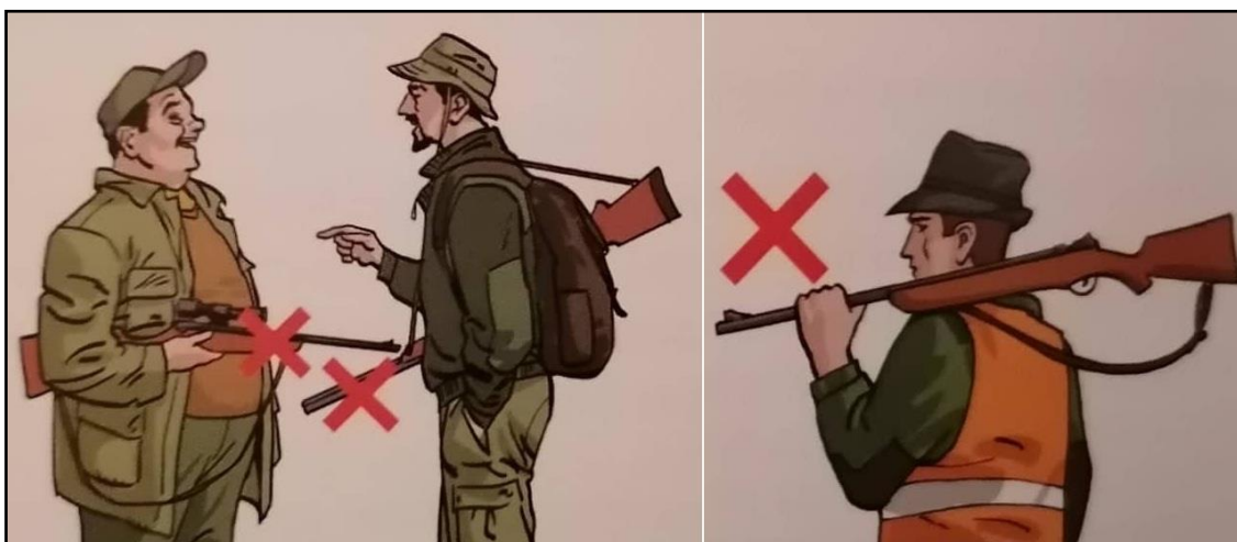
Sl. 9. Nepravilno držanje oružja u lovu [8]

Također među ove opasnosti spada i neadekvatno nošenje oružja, koje predstavlja veliku opasnost ukoliko se nosi vodoravno, te ga je potrebno nositi okomito na leđima da cijev gleda u zrak. Isto to oružje se treba prenositi u koferima ili navlakama, te se držati u posebnom ormaru pod ključem odvojenim od streljiva.