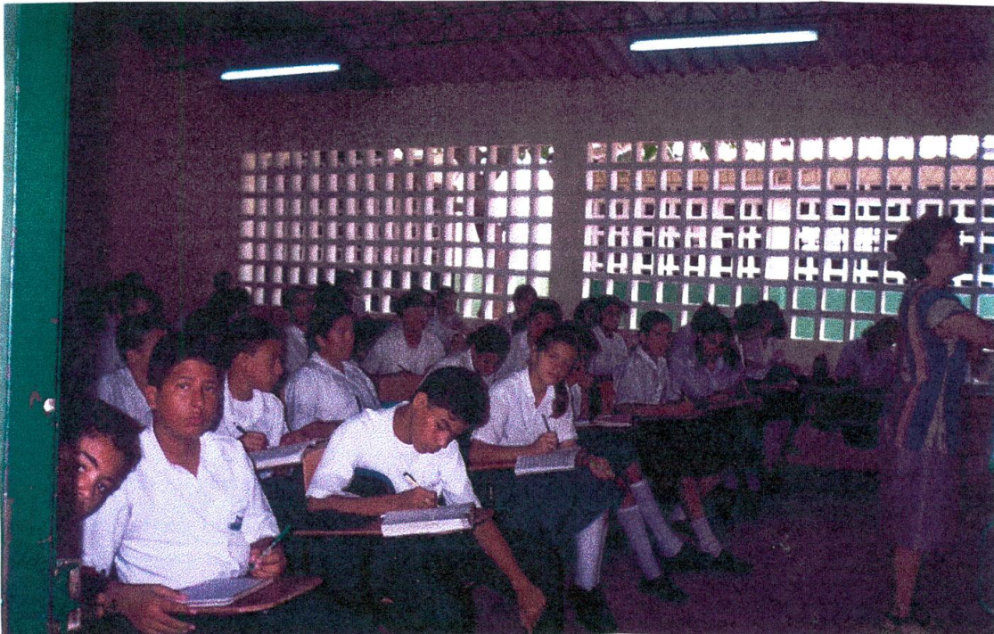
LOS ALUMNOS DEL COLEGIO MIS PRIMERAS LETRAS REALIZANDO LA INTERPRETACION DE LAS LECTURAS