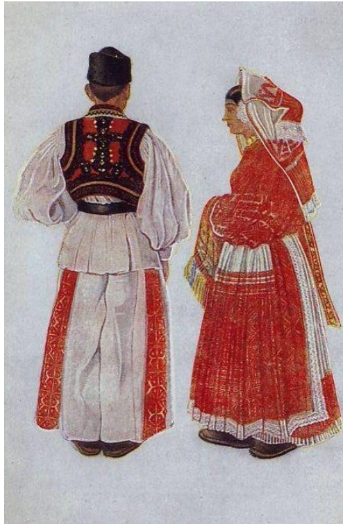
Slika 3. Tradicionalne Turopoljske narodne nošnje