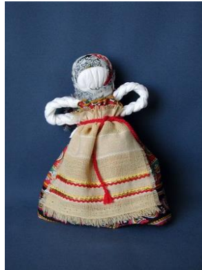
Slika 14. Lutka od tkanine

Pri opisu dječjih igara na području Turopolja Ana Vujnović ističe da su se djevojčice najradije igrale bebom (lutkom) koju su najčešće same izrađivale od slame i tkanine. Lutku su tetošile, milovale, uređivale i nosile u šetnju, polagale u krevet, šile joj odjeću oponašajući majku. Igrale su se i posuđem izrađenim od drveta ili komadima od razbijenog posuđa ili su ga izrezale od kakvog povrća ( krumpira, buče i sl.).