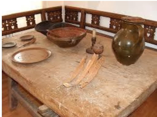
Slika 4. Tradicionalni Turopoljski stol i posuđe