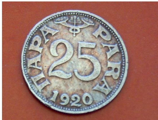
Slika 13. Kovanica od 25 para za igru kupčanje

Kupčajne se igralo s metalnim novčićima. Igrali su se dječaci, najmanje njih dvojica, ali ne više od šest. Na glatkoj zemljanoj površini, obično u nečijem dvorištu, ucrtana je ravna crta duga približno metar i pol. Na četiri do pet metara od nje ucrtana je druga paralelna crta. Na nju su stali igrači. Svaki od njih je bacio metalni novčić što je mogao bliže. Prije Drugog svjetskog rata to je najčešće bila kovanica od 25 para (jedan dinar = sto para). Onaj koji je bio najbliži crti pokupio je sve novčiće, u nizu ih je posložio na dlan, sve pismom ili glavom okrenute prema gore, ovisno o tome kako su se prethodno dogovorili. Bacio bi ih u zrak tako da se u zraku okreću. Kada su pali, svi novčići koji su bili okrenuti prema gore pokupio bi bacač. Sljedeći je bacio ostatak i tako se nastavljalo dok se imalo što bacati.