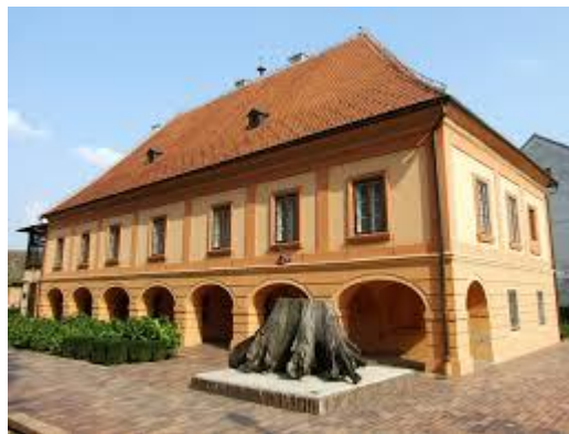
Slika 2. Muzej Turopolja

Posjetom muzeju saznaje se čime su se bavili Turopoljci, kako su se odijevali i kako su im bile uređene kuće.