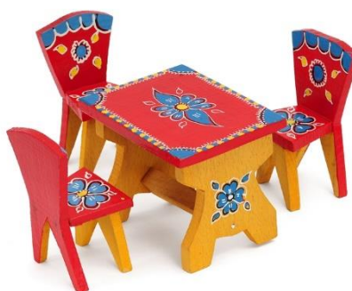
Slika 21. Stol i stolice