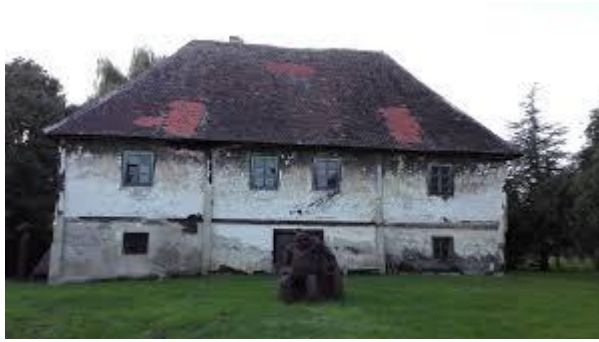
Slika 8. Kurija Alapić