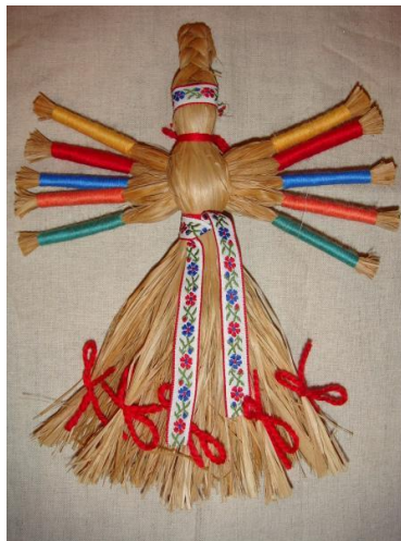
Slika 15. Lutka od slame