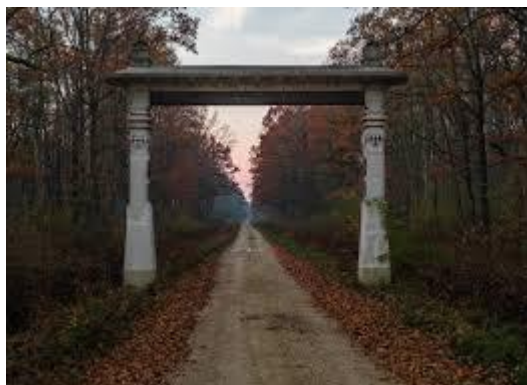
Slika 9. Vrata od krča

Vrata od krča predstavljaju spomen ljudskom radu. Naime, Turopoljci su bogatstvo šuma čuvali jer im je donosilo velike prihode. U nekim periodima kroz povijest su ih i krčili kako bi stvorili dovoljno obradive površine. Matković Mikulčić (2010) iznosi razlog nastajanja Krčkih vrata kao posljedicu jednog krčenja u Turopoljskom lugu koje je trajalo od 1774. do 1779. godine. Zemlja je nakon toga bila podijeljena na 1600 jednakih parcela. U čast tom velikom uspjehu podignuta su Vrata od krča na granici krčevine i ostatka šume. Danas su napravljena od betonskih stupova, a prvotno su bili drveni stupovi preko kojih se protezala hrastova greda s natpisom koji govori o ovom pothvatu.