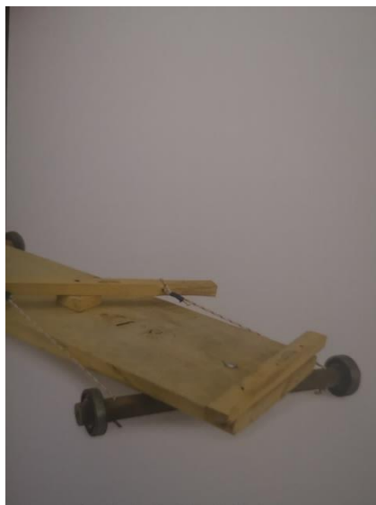
Slika 18. Igra karting

Jedna od poznatih igara bila je i karting . Igru su uglavnom igrali dječaci koji su se vozili i natjecali u brzini tamo gdje nije bilo puno ostalog prometa. Kočili su bosim tabanima ili cipelama. Vozilo igračka je izgrađena od daske ili šperploče koja je pričvršćena na drvene poprečne letvice s čije su donje strane pričvršćeni kuglični ležajevi. Dječaci su bili puno puta kažnjeni od roditelja batinama ili dodatnim radom ako su cipele bile uništene zbog oštećenja uzrokovanog kočenjem. Obzirom na ležajeve koji su bučili prilikom vožnje grdili su ih i stariji mještani.