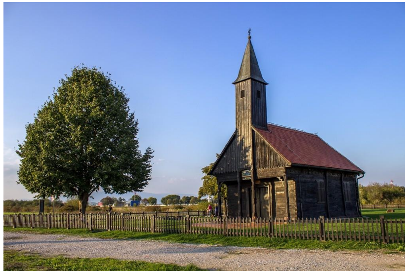
Slika 11. Kapela ranjenog Isusa

„Građena je od hrastovih planjki sa zanimljivo riješenim pročeljem. Blago isturen toranj – zvonik oslanja se na dva stupa trijema i uzdiže visoko nad krovom. Stupovi trijema su izrezbareni, a krajevi dasaka koje zatvaraju zabat ispiljene su u obliku kišnih kapi“(Matković Mikulčić, 2010, str. 84). Nalazi se u neposrednoj blizini Međunarodne zračne luke Franjo Tuđman pa bi se njen lokalitet mogao značajnije upotrijebiti u turističke svrhe za putnike koji su u ovoj luci u transferu.