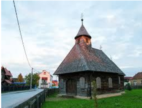
Slika 12. Kapela sv. Ivana Krstitelja