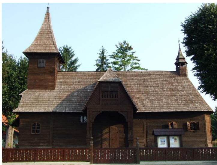
Slika 10. Kapela sv. Barbare

Kapela sv. Barbare nalazi se u Velikoj Mlaci. Najatraktivniji je primjerak drvene sakralne kapele baroknog razdoblja i spomenik nulte kategorije. Posebna joj je odlika s obzirom na vanjsko uređenje krov koji je cijeli izrađen od drvenih hrastovih letvica ili daščica. U unutrašnjosti se može kao posebnost u odnosu na ostale kapele istaknuti oltar koji čini triptih. Izrađen je slikarskim tehnikama na drvenoj površini. Maroević (1997) ističe da kapela sv. Barbare omogućuje sustavno praćenje dviju faza gradnje do današnjeg izgleda. Osnovno obilježje s obzirom na umjetnička razdoblja je poslijebarok. Na „pristašku“ (svod ulaznih vrata) su urezane brojke 1642. (gradnja kapele) i 1912. (dogradnja trijema). Urezana je i 270 godišnja tradicija turopoljskog tesanja i gradnje u drvu (Maroević, 1997).