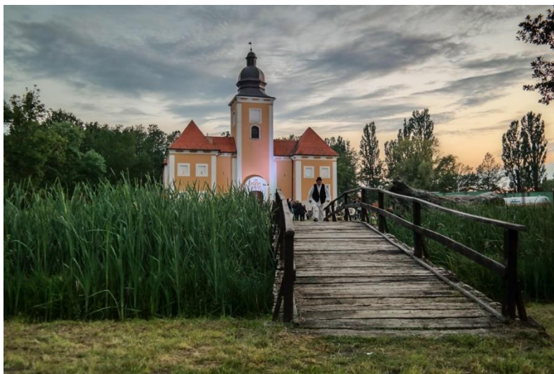
Slika 5. Grad Lukavec

Stari grad Lukavec otvoren je za posjetitelje uz prethodnu najavu. Djeca predškolske dobi i učenici osnovnih škola Turopolja i okolice, pa i učenici grada Zagreba i bližih županija redovito ga posjećuju. Važan je za obradu zavičajne nastave u trećem razredu osnovne škole kada ga učenici svih osnovnih škola koje pripadaju gradu Velika Gorica obvezno posjećuju u sklopu terenske nastave.