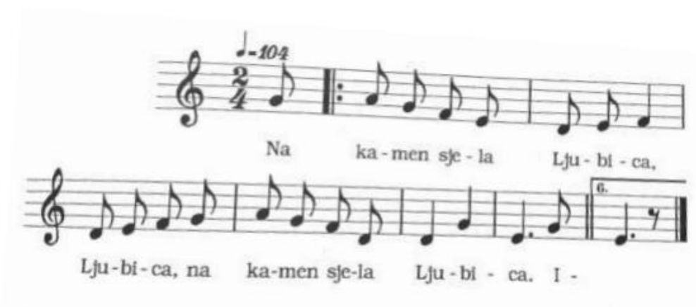
Slika 22. Na kamen sjela Ljubica

Na kamen sjela Ljubica (Donja Lomnica, Turopolje)