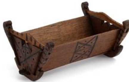
Slika 19. Zipka

Osim raznovrsnih pletenih proizvoda potrebnih gospodarstvu i kućanstvu, pleli su košarice za djevojčice i kolica za lutke. Najviše su ih pleli muškarci u zimskim mjesecima, a pri izradi su rabili šibe od kestena, vrbe, suhu šumsku travu i slamu. Najčešće su se koristili divljim šibama zelene boje i pitomim žutim šibama. Šibe su nekoliko sati namakali u vodi da omekšaju i postanu savitljive (Biškupić Bašić,2018).