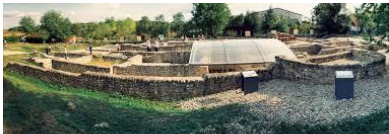
Slika 6. Arheološki park Andautonija

„Arheološkim istraživanjima otkrivene su ceste, gradske ulice, sistem kanalizacije te javne i stambene zgrade. Pronađen je i raznovrstan arheološki materijal: zidne slike s ornamentima, kockice mozaika, oruđe, posuđe, staklene posude, brončani nakit, novac careva i razni drugi predmeti za svakodnevnu uporabu.“ Razni predmeti pronalaze se i dan danas i prema nekim povjesničarima i arheolozima potrebna su opsežna istraživanja ovog područja koja bi nam mogla rasvijetliti još neke nedoumice vezane za prošlost ovog kraja. Proljeće u Andautoniji poznatije kao Dani Andaunije je manifestacija koja se održava zadnji vikend u travnju. Posjetitelji se mogu upoznati s rimskom tradicijom i sudjelovati u brojnim radionicama (odjevanje u rimsku odjeću, kušanje rimske hrane, rimske igre). Ovakvi dani organiziraju se i tijekom rujna ili listopada sa sličnim sadržajima, ali ovoga puta s naglaskom na zahvalnost za plodove koje ubiremo na poljima u jesen. Djeca predškolske i školske dobi ovdje imaju mogućnost neposrednog upoznavanja s prošlošću i običajima ovog kraja koji može biti i ne mora mjesto njihova rođenja. (TZ Velika Gorica, 2009).