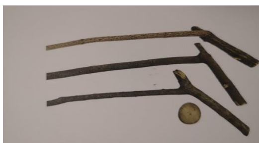
Slika 17. Igra kuturanje