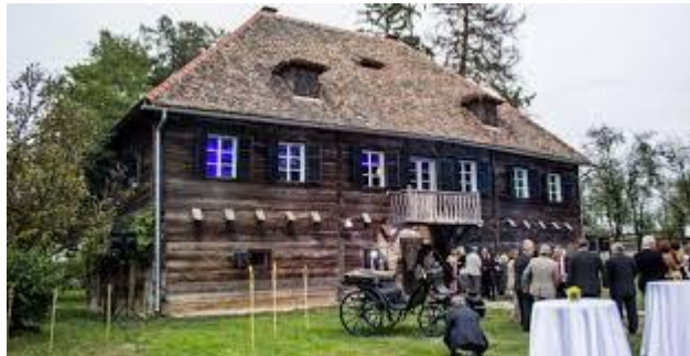
Slika 7. Kurija Modić Bedeković

Kurija Modić – Bedeković nalazi se u Donjoj Lomnici. Najsčačuvanija je kurija u Turopolju. Sagradio ju je Petar Modić 1806. godine i svjedoči o bogatoj povijesti onih koji su u njoj živjeli. „Podni mozaici, peći, stilski namještaj, slike, svjetiljke i porculan svjedoče o bogatoj povijesti ove kurije u čijem su salonu osim turopoljskih plemića, stalni posjetitelji bili i umjetnici i književnici Z. Baloković, F. Lučić, J. Andrić, A. Šenoa i A. G. Matoš.“ Matković Mikulčić (2010) opisuje kuriju kao moćnu i otpornu jer je preživjela Napoleonova osvajanja te I. i II. svjetski rat. Odlika joj je jednostavnost gradnje i praktičnost u rasporedu prostora.