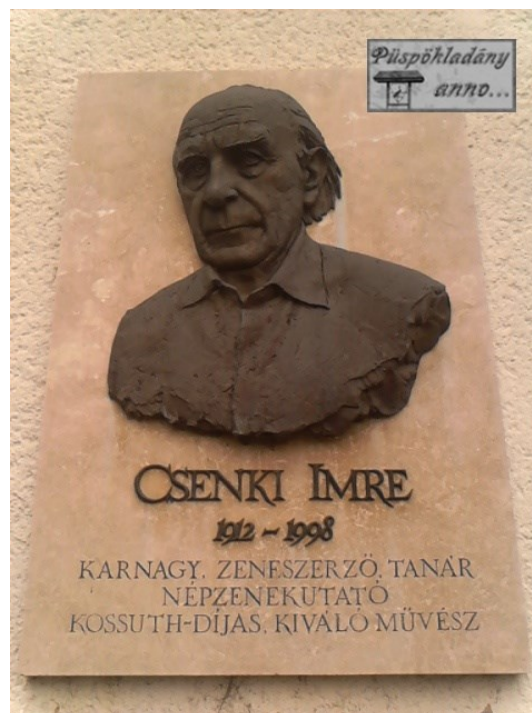
8. kép: Csenki Imre emléktáblája a nevét viselő, Csenki Imre Alapfokú Művészeti Iskola falán Püspökladányban

Összegezve II. világháború utáni debreceni tevékenységét, a tanítás mellett vezette a Kollégiumi Kórust, a Csokonai Kórust, az Egyetemi Énekkart és a MÁV Filharmonikus Zenekart. A városhoz való ragaszkodása élete végéig megmaradt, készülő, nagy tervei pedig egyelőre még marasztalták. Együtteseivel elért sikerei mély emberi, művészi és társadalmi kötődéseket hoztak számára, amelyek elszakíthatatlannak tűntek, de jött a nagy és váratlan átalakulás, a tanítóképzők államosítása, és a kialakult bizonytalan helyzetnek engedve egyre közelebb került ahhoz, hogy a fővárosba költözzön. Végül 1950-ben Budapestre távozott az Állami Népi Együttes énekkarának élére. Tóth Ervin helyi művészettörténész így méltatta: „... A karvezető, a Debrecenben töltött éveire mindig hálával és szeretettel emlékszik vissza és a város is hálával gondol vissza a mesterre, aki Debrecen zenei életének fellendülésében nagy szerepet játszott. Olyan zenei együttest nevelt fel, aki amellet, hogy a város hírnevét öregbítette az utókor számára is például szolgált. ” 25 Aktív debreceni művészeti működésének bemutatását számtalan sikeres, zenetörténeti korszakalkotó eseménnyel tudnánk még folytatni, azonban a több egyházi tanintézet, így a kollégiumi tanítóképzés összevonása, beolvadása vagy megszűnése utáni, 1950-nel kezdődő új helyzet ismertetése már nem tárgya e tanulmánynak.