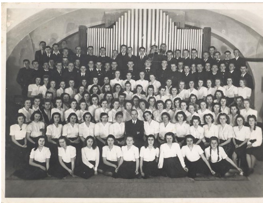
4. kép: A Kollégiumi Kórus