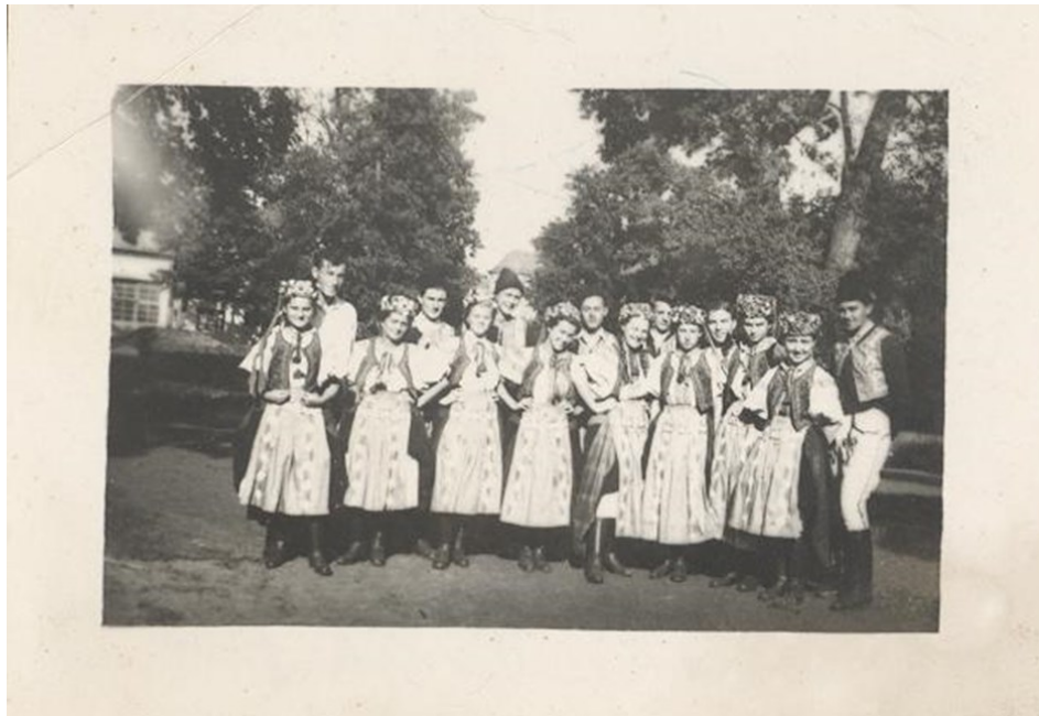
6. kép: A Kollégiumi Kórus népviseletben.

Ezen kívül számos tudományos célt és feladatot jelöl meg, többek között: tanárok és növendékek népdalgyűjtő munkája fonográffal, egyházi melódiák hiteles lejegyzése, felvétele, a gyűjtések feldolgozása, kiadása, a vidéki területek zenei monográfiáinak elkészítése, zenepedagógiai és zenepszichológiai tudományos vizsgálatok végzése, tehetségvizsgálatok, kísérletek, protestáns egyházzenei folyóirat létrehozása, hangverseny-látogatások, tanulmányutak bel- és külföldön, rokon népek népzenejének megismerése. Művének megírásához elsősorban Bartók és Kodály, Karácsony Sándor, valamint rangos hazai zenei folyóiratok írásait használta forrásként.