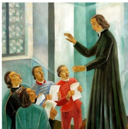
1. kép: Az első Kántus

Az elavult és korszerűtlen, szűkös társadalmi és egyházi viszonyrendszer nem eredményezhetett magasztos templomi éneklést Debrecenben, annak híres református kollégiumában, az „ország iskolájában”. Nem győztek e miatt szégyenkezni a tanult városiak. Maróthi György professzor csaknem páratlan személyiség volt a sikeres újítók között, aki a kollégiumi diákok istentiszteleti és temetési alkalmi éneklési szokását teljesítette ki 18. század eleji tevékenysége során. Kórust szervezett az 1739. évi pestisjárvány idején, ezzel megalapítva a Kántust. 1