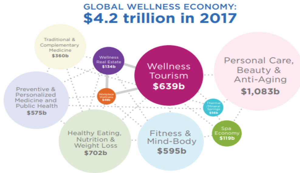
Slika 1. Wellness ekonomija prema procjenama GWI iz 2017.

Prema procjenama Global Wellness Institute-a (GWI), ukupna vrijednost Wellness ekonomije u svijetu premašuje vrijednost od 4.2 trilijuna američkih dolara. Wellness ekonomiju čini deset kategorija, prikazanih na slici ispod. 49