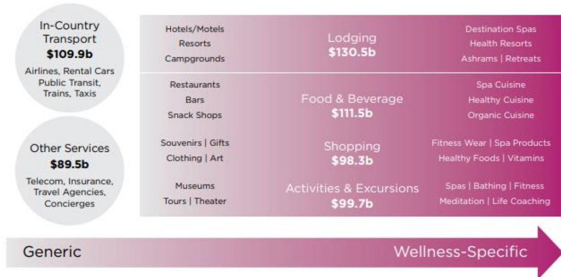
Slika 2. Wellness turizam prema procjenama GWI iz 2017.