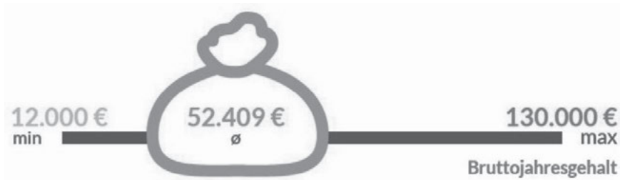
Abbildung 7: Gehälter unter angestellten UX/Usability Professionals

Der mittlere Stundensatz unter selbstständig tätigen UX/Usability Professionals liegt bei 63€ (min=11; max=80; sd=19), der mittlere Tagessatz bei 697€ (min=500; max=1.000; sd=189) mit einer durchschnittlichen Auslastung von 154 Tagen pro Jahr (min=70; max=365; sd=64).