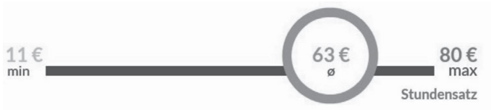
Abbildung 8: Stundensätze unter selbstständig tätigen UX/Usability Professionals

Der mittlere Stundensatz unter selbstständig tätigen UX/Usability Professionals liegt bei 63€ (min=11; max=80; sd=19), der mittlere Tagessatz bei 697€ (min=500; max=1.000; sd=189) mit einer durchschnittlichen Auslastung von 154 Tagen pro Jahr (min=70; max=365; sd=64).