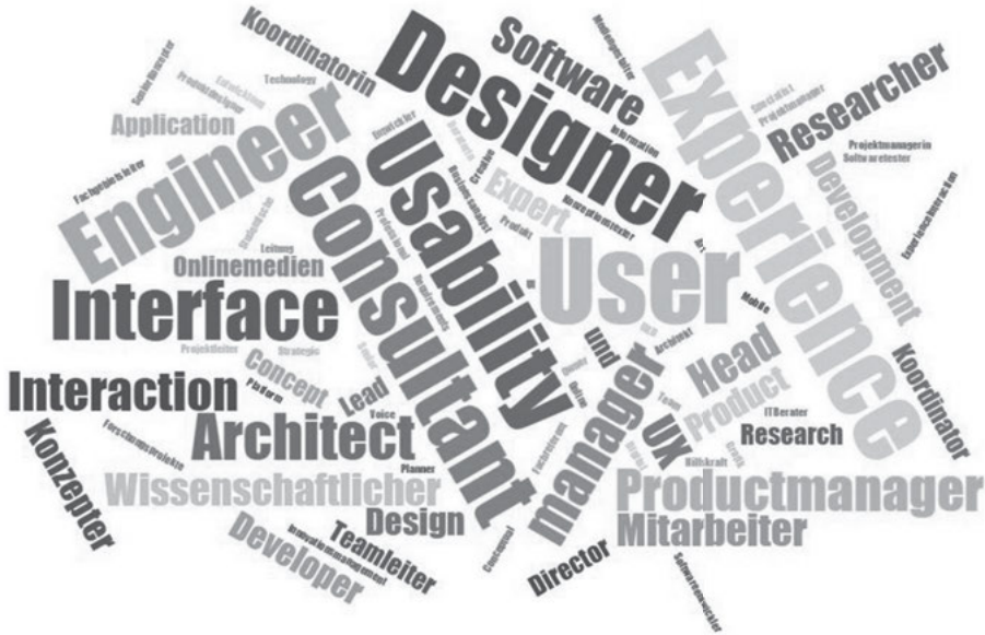
Abbildung 6: Vielfalt der Jobtitel in der UX/Usability-Branche

Bei ihrem aktuellen Arbeitgeber sind die Befragten im Schnitt seit 3,9 Jahren ( sd=3,9 ; min=0 ; max=27 ; med=3 ) angestellt. Mit 23% hat rund ein Viertel der Angestellten Personalverantwortung, wobei die Übertragung von Personalverantwortung mit andauernder Unternehmenszugehörigkeit wahrscheinlicher wird ( r=.18^* ) und mit höherem Bruttogehalt einhergeht ( r=.20^* ).