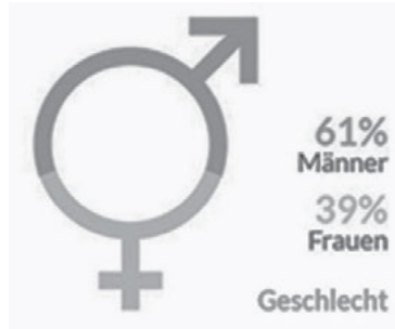
Abbildung 1: Geschlechterverhältnis in der UX/Usability-Branche