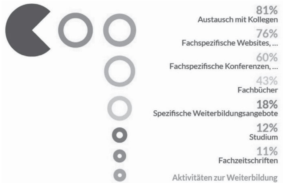
Abbildung 3: Wichtigste Aktivitäten zum UX/Usability-Wissenserwerb