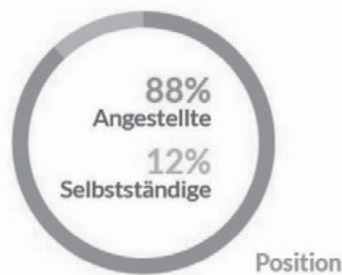
Abbildung 5: Verhältnis von Angestellten und Selbstständigen in der UX/Usability-Branche

Zur differenzierteren Erhebung der momentanen Arbeitssituation wurden die Teilnehmer im Laufe der Befragung in Arbeitnehmer und Arbeitgeber/Freiberufler geteilt. 88% der befragten UX/Usability Professionals arbeiten in einem Angestelltenverhältnis, 12% sind selbstständig tätig als Freelancer oder Unternehmensinhaber. Im Folgenden sind Kennwerte und Analysen zur Situation beider Personengruppen getrennt aufgeführt.