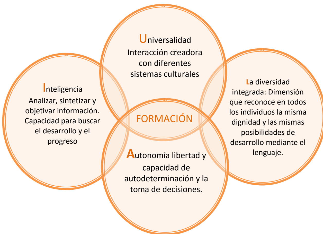
Grafica 2. Elaboración del equipo investigador con base en el artículo La Formación como principio y fin de la acción pedagógica. Revista Educación y Pedagogía, vol. XIX, núm. 47, Enero-Abril de 2007.

Por tanto, se precisa reconocer que la formación está ligada con el desarrollo de cualidades y valores que impactan en la evolución personal y social del sujeto. La formación parte de la idea de desarrollar equilibrada y armónicamente diversas dimensiones, entre las más imperantes “ la universalidad, la autonomía, la diversidad integrada y la inteligencia ” (Flórez Ochoa, 2007, p.167), que permitan formar en lo intelectual, lo humano y lo social. Es decir, se debe orientar al estudiante a desarrollar procesos informativos y formativos. El siguiente esquema presenta en forma más detallada las dimensiones expuestas por Flórez Ochoa, en el cual se puede apreciar como la interacción de estas, engloban una formación holística que todo estudiante debería poseer y tener acceso en las instituciones educativas.