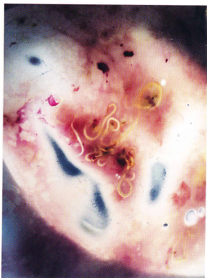
Fig. 2. Leverorm i lever fra Østersøtorsk.

ormene i torskens lever er larvestadier (Fig. 2). Man kan se ormene med det blotte øje selvom en lup eller et mikroskop hjælper (Fig. 3). Den kraftige ormeinfektion hænger således uløseligt sammen med den voksende bestand af gråsæler i Østersøen (Fig. 4). Smitten fra sælerne til torskene sker ved, at orme-æg (fra de voksne hunorm i sælens mavesæk, og som ofte er op til 9 cm lange) passerer ud i vandmiljøet med sælens afføring, hvorefter æggene klækkes i havet ved at en lille mikroskopisk larve smutter ud af ægget. Små vandlopper og andre smådyr kan æde larven og bære den videre i økosystemet. Man kalder derfor vandlopperne for transportværter. Når små fisk (såsom brisling, sild, hundestejler eller tobis) æder den inficerede vandloppe, bliver disse små fisk også angrebet og tjener også som transportværter. Ormelarverne i vandloppen er langt mindre end 1 mm lang, medens ormen i brislingen vokser og bliver henved 6 mm i længden. I torsken kan ormene nå en længde på 2-3 cm. Når torsken ædes