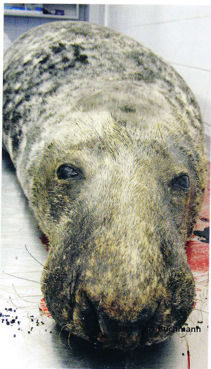
Fig. 4. Hoved af gråsæl.