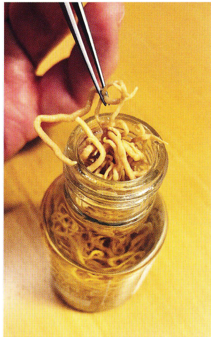
Fig. 1. Voksen orm fra sælens mavesæk.

Leverormen har fået tildelt det videnskabelige navn Contracaecum osculatium og er en parasit, som har sit voksne stadium i sælens mavesæk (Fig. 1), medens