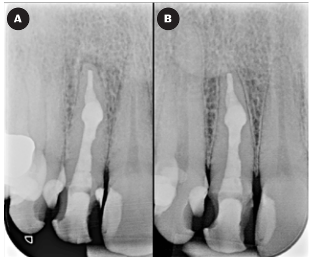
Fig. 4. Postoperativt billede af behandling af 2+ (A). Syv måneders kontrolbillede af 2+ med gendannet lamina dura apikalt (B).