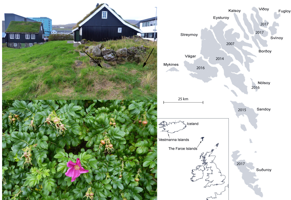
Fig. 2-4. Øvest til venstre. Fund af et Bombus lucorum humlebi-bo på Færøerne, Tórshavn, Streymoy. Nederst til venstre. Rosa rugosa busk med hyben, Nólsoy i 2017. Til højre. Spredningsforløb af Bombus lucorum på Færøerne.

Selv om der i den færøske udmark findes mange blomstrende Vaccinium spp., Empetrum spp. og Rubus saxatilis , ses der kun meget få bær. I de områder hvor Bombus lucorum er udbredt, ses en meget tydelig forandring på Rosa rugosa buskene, som tidligere kun havde meget få eller slet ingen hyben, men som nu hænger med hyben i store klaser (fig. 3). Også træer som guldgrenn får nu mange frøbælge i forhold til tidligere. Det må formodes, at artens tilstedeværelse i udmarken også vil påvirke den lokale (vilde) flora her.