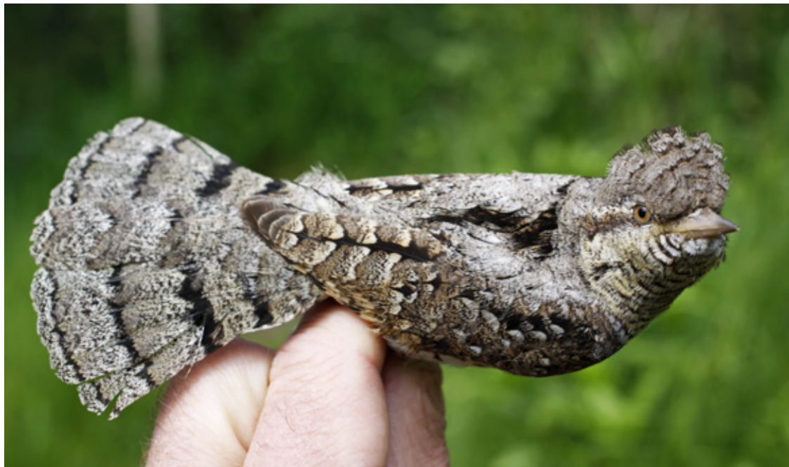
Vendeheals 2k+, Blåvand, 24. maj 2015.

I alt blev ringmærket 183 arter i Danmark i 2015, hvoraf ingen var nye ringmærkningsarter. Der blev mærket mere end 1.000 individer af 23 arter i 2015, og der blev mærket mere end 100 individer af 68 arter.