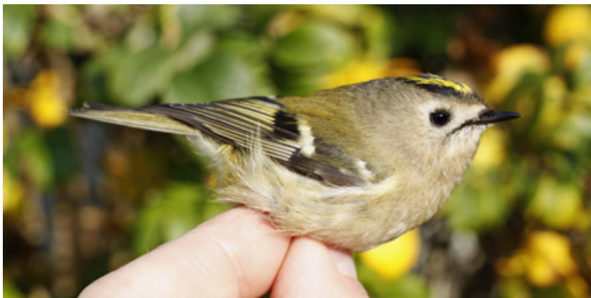
Fuglekonge, 1K hun, Blåvand, 29. oktober 2015.

Fra Italien blev modtaget 15 genmeldinger af 12 dansk-mærkede fugle (skarv (5), sølvmåge, splitterne (4), sivsanger (3), munk (2)) og tre fugle mærket i Italien blev genmeldt i Danmark (munk (2), gransanger). Gransangeren blev mærket 13/4 2015 på Sardinien (fig. 2), og fundet død 25 dage senere, 8/5, ved Vamdrup syd for Kolding, en tur på 1.602 km i lige linje.