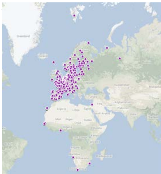
Figur 1. Den geografiske fordeling af genfundet i udlandet af fugle ringmærket i Danmark og som er behandlet af Ringmærkningscentralen i 2016 (n=1.050).