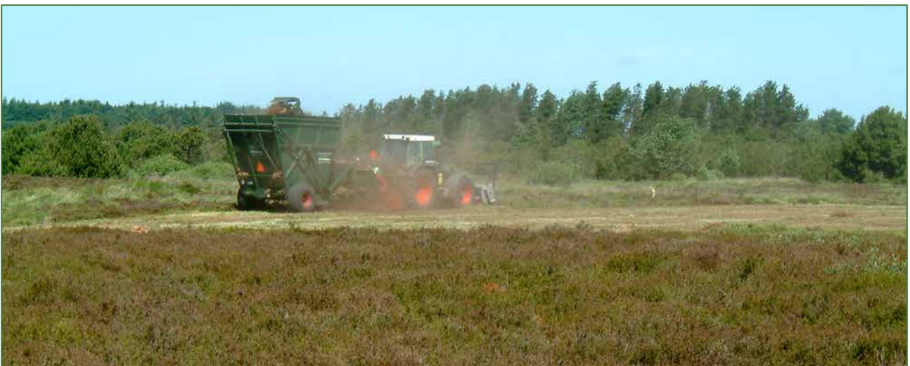
Maskinslåning på Hjelm Hede. Heden har været slået ca. hvert 7 år.

På hederne er der de seneste år brugt f.eks. lynghøster, som kan slå store arealer på kort tid. Det resulterer ofte i monokulturer af lyngmarker. Desuden udjævner de store maskiner jorden, så den mikrotopografiske variation mindskes jf. billederne fra Kongenshus og Hjelm Hede.