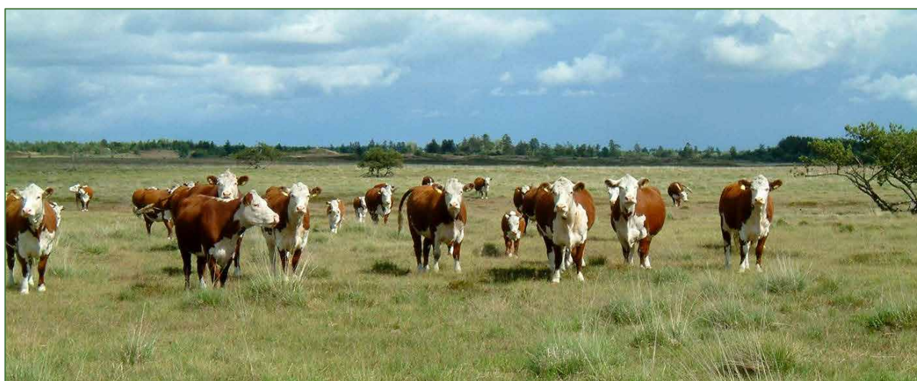
Græsning på Randbøl Hede