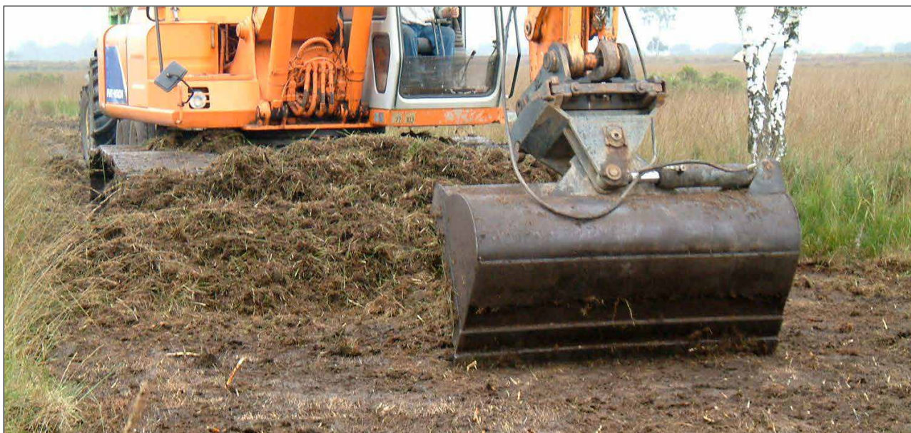
Tørveskrælning i Holland.

Foruden en meget stor N-fjernelse, fjernes der også en stor del af P puljen fra jorden. Der mangler solide undersøgelser over, hvad det betyder for næringsstofbalancen på længere sigt. Umiddelbart vil en intensiv brand ned til mineraljorden på mindre områder tilsvarende blotte mineraljorden, men samtidig opretholde en bedre N:P:Kation balance end ved tørveskrælning. I Holland eksperimenterer man i øjeblikket med tilførsel af stenmel for at tilbageføre mineraler til tørveskrællede områder (Smits, 2015). Fjernelse af tørvelaget vil fjerne en meget stor del af jordens kulstofpulje. Dermed vil jordens evne til at tilbageholde N være reduceret. Härdtle m.fl. (2009) finder da også signifikant højere udvaskning efter tørveskrælning på hede på 4 kg N/ha/år, men ingen forhøjet udvaskning af P.