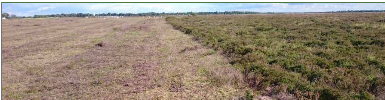
Maskinslåning på Kongenshus Hede i 2016.