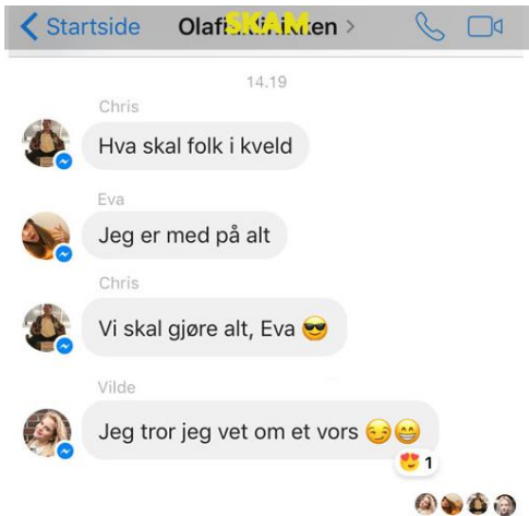
Figur 2. SMS-udveksling mellem Chris, Eva og Vilde, SKAM-bloggen 4. sæson.

Selvom engelske ord og udtryk er fraværende i denne sekvens, betyder det ikke at pigerne ikke inddrager engelsk i deres sprog. Men der er en tendens til at de i nogle sammenhænge gør det på en lidt anden måde end drengene. Det er vores opfattelse at pigerne i højere grad end drengene bruger engelsk i situationer hvor de vil sætte en personlig grænse eller understrege en bestemt position, relation eller identitet. Det ses f.eks. i anden sæson hvor Noora i sin indre kamp om at overgive sig til forholdet til William, må have lidt tid til sig selv fordi hun "trenger space ". Eller da pigerne i sæson et i deres bus-gruppe bliver enige om at de skal være " strong and independent ". Tendensen ses også i chat-udvekslingerne. Nedenfor ses et eksempel fra fjerde sæson hvor Vilde og Sana forsikrer hinanden om at deres venskab er lige stærkt som altid, trods de foregående ugers misforståelser og gensidige mistro. Her bruges engelsk til at bekræfte pigernes stærke relation: