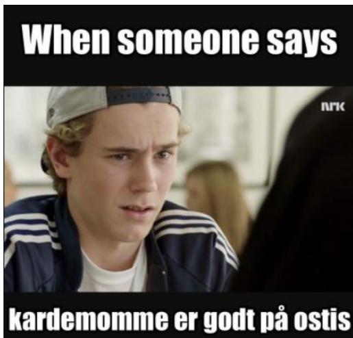
Figur 5. Meme fra facebook-gruppen Kosegruppa DK

Som et vidnesbyrd om SKAM s store internationale fanskare findes der desuden en lang række virtuelle fællesskaber på fx Tumblr og Twitter bestående af fans, der har sat sig for at lære norsk udelukkende for at kunne se SKAM på originalsproget, xi ligesom serien har affødt sin helt egen undergenre af memes hvor norsk og engelsk blandes: