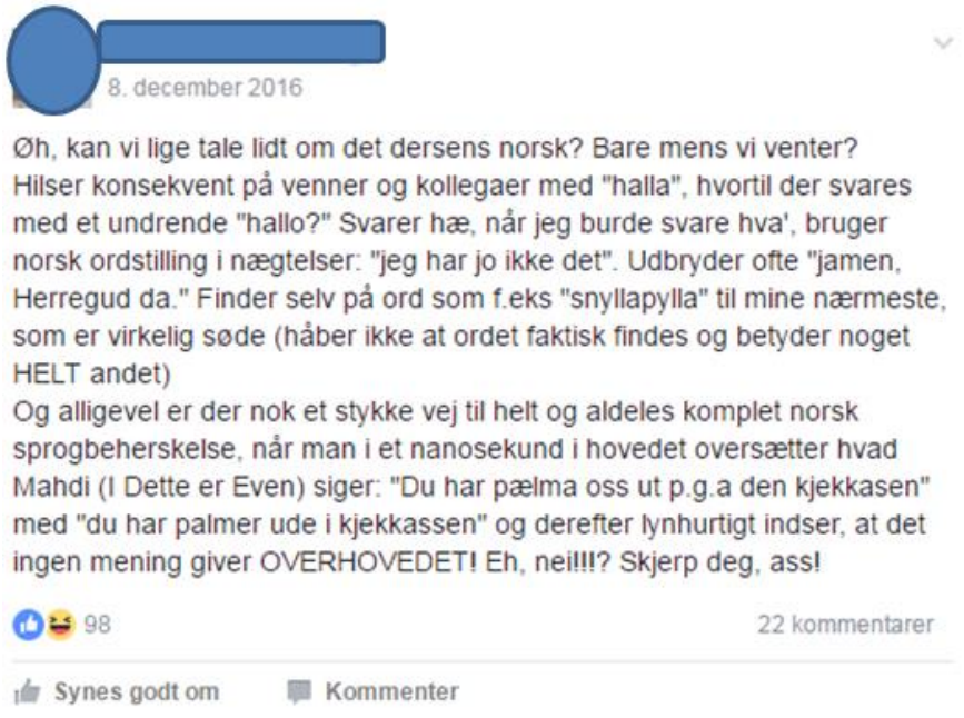
Figur 4. Kommentar på facebook-siden Kosegruppa DK.

Som et vidnesbyrd om SKAM s store internationale fanskare findes der desuden en lang række virtuelle fællesskaber på fx Tumblr og Twitter bestående af fans, der har sat sig for at lære norsk udelukkende for at kunne se SKAM på originalsproget, xi ligesom serien har affødt sin helt egen undergenre af memes hvor norsk og engelsk blandes: