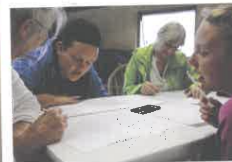
Breakfast Club inviterede over 10 dage til eftermiddagsaktioner og performances hver dag i Bisserup.