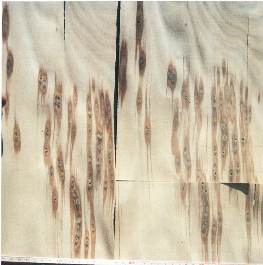
2. Finérbane med blyhaglskud frataget på Orehoved finérskrælleri.

belyses i det følgende med resultater fra projektopgaven.