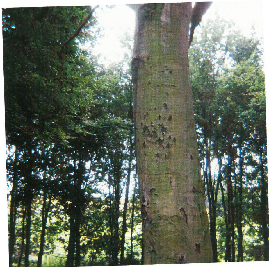
1. Bøgetræ med haglskud.

Der opfordres til at det skal fremgå af alle kontrakter om jagtleje, at stålhagl er bandlyst i skoven.