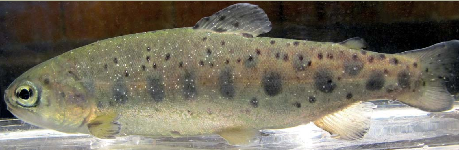
Regnbueørred ( Oncorhynchus mykiss ) inficeret med fiskedræberparasitten Ichthyophthirius multifiliis .

Genmanipulerede Yersinia ruckeri -bakterier med fiskedræberparasitens overflade-antigener, som fluorescerer grønt ved belysning med 488nm pga. proteinet GFP.