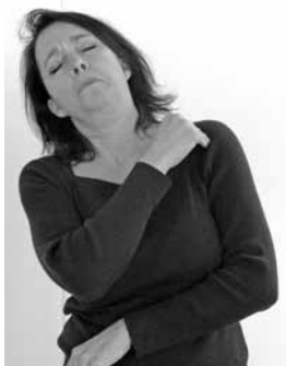
VÆKKE udført med hånden på venstre skulder (referentperspektiv hos patienten).

Også mimik der udtrykker følelser, har børnene svært ved at administrere. P7;4 spærrer øjnene op (bøllens referentperspektiv) da hun beskriver den lille mand nærme sig i Bøllen , men hun har samtidig øjenkontakt med modtageren (fortællerperspektiv), og den kombination betyder efter de voksnes sprognorm at det var fortælleren der blev overrasket.