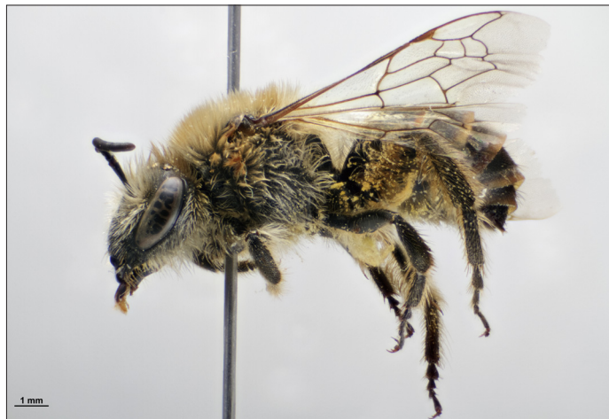
Fig. 2. Hun af silkebie Colletes halophilus Verhoeff, 1943, Sønderho, Fanø (WJ), 19.IX.2014, Hans Thomsen Schmidt leg.

Female Colletes halophilus Verhoeff, 1943, Sønderho, Fanø (WJ), 19.IX.2014, Hans Thomsen Schmidt leg.