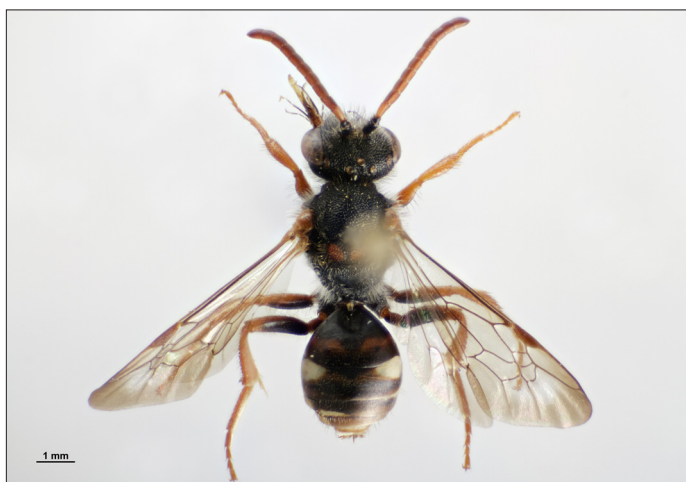
Fig. 3. Hun af hvepsebien Nomada obscura Zetterstedt, 1838, Ålbæk Klitplantage (NEJ), 06.V.2001, Rune Bygebjerg leg.

Female Nomada obscura Zetterstedt, 1838, Ålbæk Klitplantage (NEJ), 06.V.2001, Rune Bygebjerg leg.