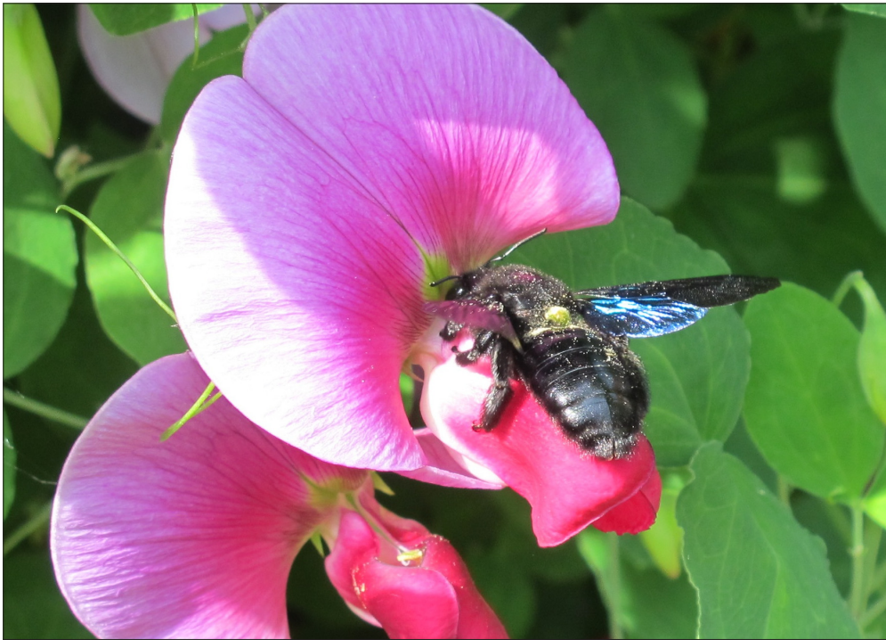
Fig 4. Hun af tømrrerbien Xylocopa violacea (Linnaeus, 1758) på afrikansk fladbælg ( Lathyrus tingitanus ), Brede (NEZ), 08.VI.2014. Female Xylocopa violacea (Linnaeus, 1758) on Tangier pea (Lathyrus tingitanus), Brede (NEZ), 08.VI.2014.

lebieer kan tømrrerbierne let kendes på deres behårede bagben uden pollenkurv (corbicula). Derudover er deres kraftige hoved ofte ligeså bredt som mesoscutum (øvre mellemkrop), i modsætning til det lidt smallere hoved på humlebieer.