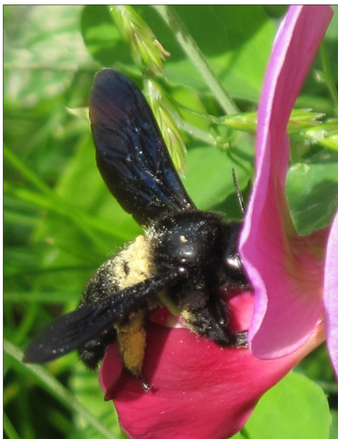
Fig 5. Hun af tømmerbien Xylocopa violacea (Linnaeus, 1758) på afrikansk fladbælg ( Lathyrus tingitanus ), Brede (NEZ), 09.VI.2014. Bemærk pollen.

Female Xylocopa violacea (Linnaeus, 1758) on Tangier pea (Lathyrus tingitanus), Brede (NEZ), 09.VI.2014. Note the pollen.