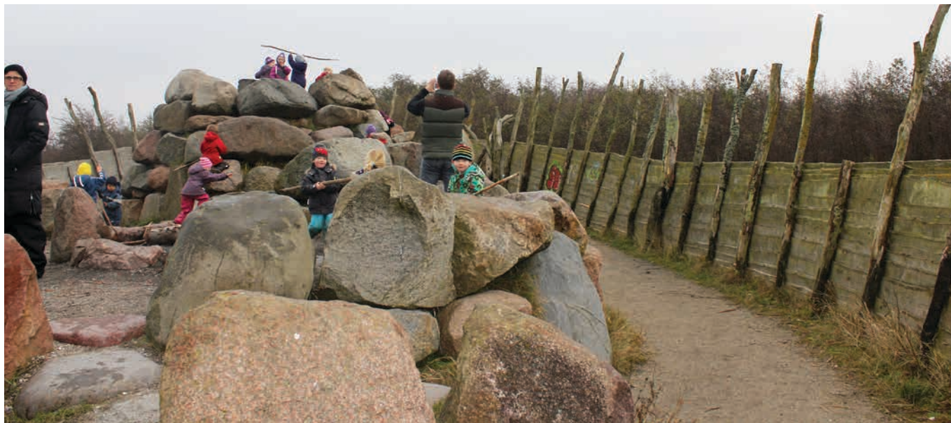
Figur 26. Leg på store bunker af sten.

De fleste naturlegepladser inspirerer intuitivt til bevægelse. Samtidig peger forskning på en motorisk effekt af børnenes leg i naturlige miljøer (se kapitel 2). Der er mange eksempler på faciliteter, der understøtter, at børn bevæger sig. Mere motionsrettede tarzanbaner eller motionsbaner har et meget eksplicit fokus på sundhed og bevægelse. For flere eksempler henvises til hæftet om friluftsfaciliteter – motion og sundhed.