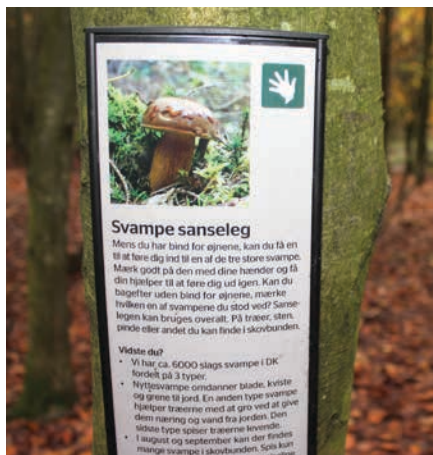
Figur 17. Ved Svampebasen kan børn lege sanslege og tilegne sig naturfaglig viden om svampe

gelser, lyde og svampe i naturområder. I både børnehave, børnehaveklasse og indskoling arbejder pædagoger og lærere ind imellem med sammenhængende undervisningsforløb, hvor erfaringer fra naturen og naturlegepladsen kan fungere som konkretisering af abstrakte temaer.