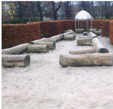
Figur 23. Legepladsen i Kongens Have i København er udelukket baseret på leg med sand i udfordrende omgivelser samt et par drager, hvis skæl ses på flere pæle.