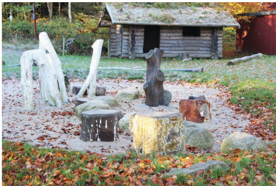
Figur 22. Skulpturer i et sandområde ved Ørnereden ved Århus. Skulpturerne er udarbejdet med inspiration fra fossiler, der er en væsentlig aktivitet ved naturcenteret.