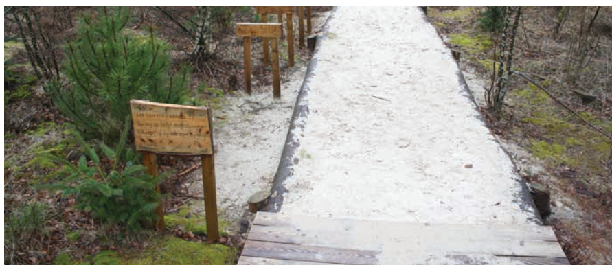
Figur 15. Base hvor børn kan afprøve deres egne evner sammenlignet med forskellige pattedyr. Hvor langt springer en hare? Kan du springe lige så langt?

Figur 16. Lyd og sansebasen ved Sletten i Midtjylland og i Rold Skov. Ved lydbasen kan man finde lyde i naturen. Ved sansebasen skal fx dyrs alder, puls mv. vurderes med reference til konkrete installationer i området.