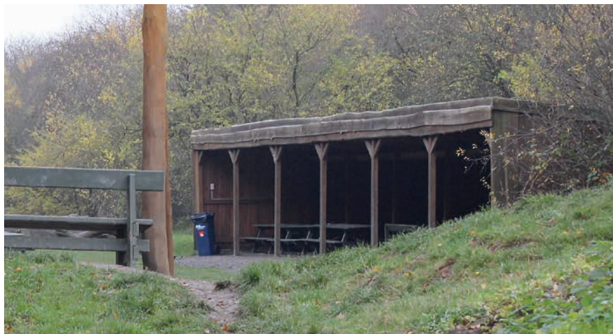
Figur 8. Eksempel på et halvtag til madpakke spising. Halvtaget er i tæt sammenhæng med legepladsen. (Vallensbæk)