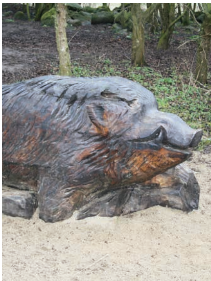
Figur 19. Ved legepladsen ved Egå Enge findes en række skulpturer, der forestiller dyr, som levede i stenalderen. Der ligger store mængder af skaller fra blåmusling og en rituel labyrinth, hvor børn kan fornemme fremmede kulturer.

Legepladsen indeholder en række skulpturer, der forestiller nordiske guder: Odins hest "Sleipner" er et vippe/vugge dyr ved siden af andre træheste. Odins to gedebukke er spændt for en stridsvogn og Midgårdsormen er en del af ophænget af en kæmpegynge. Mere traditionelle legeredskaber som legehus og svævebane har fx skulpturer af Odins to ravne Hugin og Mugin, og alle legeredskaber er udformet af massive træstykker og kalmerskårne brædder. Pladsen indeholder endvidere en fortællehytte, hvor man kan