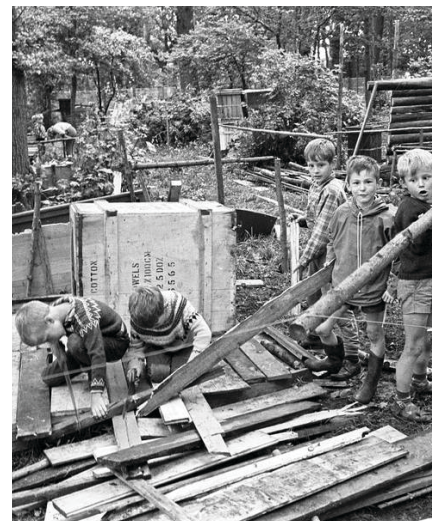
Figur 3. Børn på Odense Kommunes skrammellegeplads (1965).

På Kunstlegepladser er æstetiske ind- tryk en del af iscenesættelsen af le- gemiljøet. Her kan legepladsen være indkapslet i en kæmpe ark, fx som på