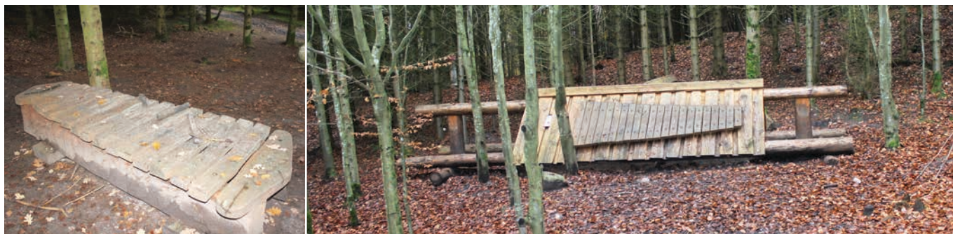
Figur 27. Eksempler på musikinstrumenter/faciliteter der kan være "skjult" i en vis afstand fra centrum af pladsen.