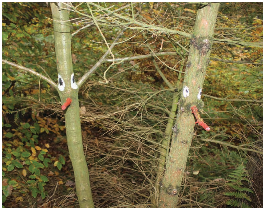
Figur 11. Vejvisere der kan lede børn til 'satellit faciliteter' med større eller mindre afstand til centrum.

Naturlegepladser betyder et slid på både legepladsarealet og områder omkring naturlegepladsen. De skal derfor