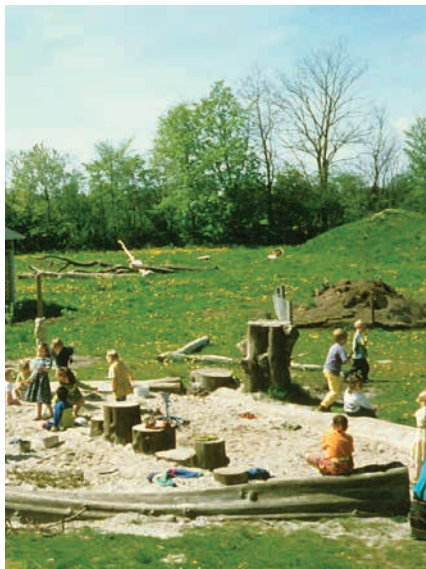
Figur 21. Eksempler på forskelligt udformede sandkasser på en række naturlegepladser.

Begge pladser kræver formidling. Legeområdet ved Egå Enge er ret åbent udformet og uden grænser til omgivelserne, mens den anden legeplads er ret lille med et hegn omkring, og pladsen er udarbejdet som et stort faldområde, idet der er mange steder, hvor børn kan kravle op.