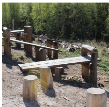
Figur 29. Eksempel på en facilitet, der sigter mod børns bevægelse. Billedet viser en lille del af en længere motionsbane i Nordsjælland.

En bunke sten (figur 26) kan fungere som siddested for mange børn, som et udfordrende og lidt farligt klatrested og som del af andre lege i nærheden. Der er mange muligheder for at balancere, klatre og eksperimentere med kroppen i forbindelse med stenkunke. Høje stenkunke som figur 26 kan dog være en udfordring i forhold til sikkerhed, se kapitel 5.