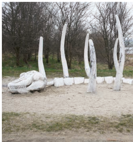
Figur 18. Billeder fra temalegepladsen ved Egå. Pladsen er tematiseret omkring jægerstenalderen.

To eksempler på temalegepladser er legepladsen ved Egå Enge, der handler om jægerstenalderen og legepladsen om vikingetiden ved Fyrkat (Hobro). De to legepladser er ret forskellige, idet legepladsen ved Egå Enge lig-