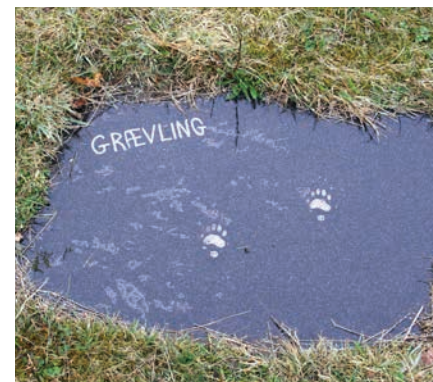
Figur 14. Spor på stenplader, der skal inspirere børn til at få øje på spor i naturområdet omkring Myrthuegård ved Esbjerg.