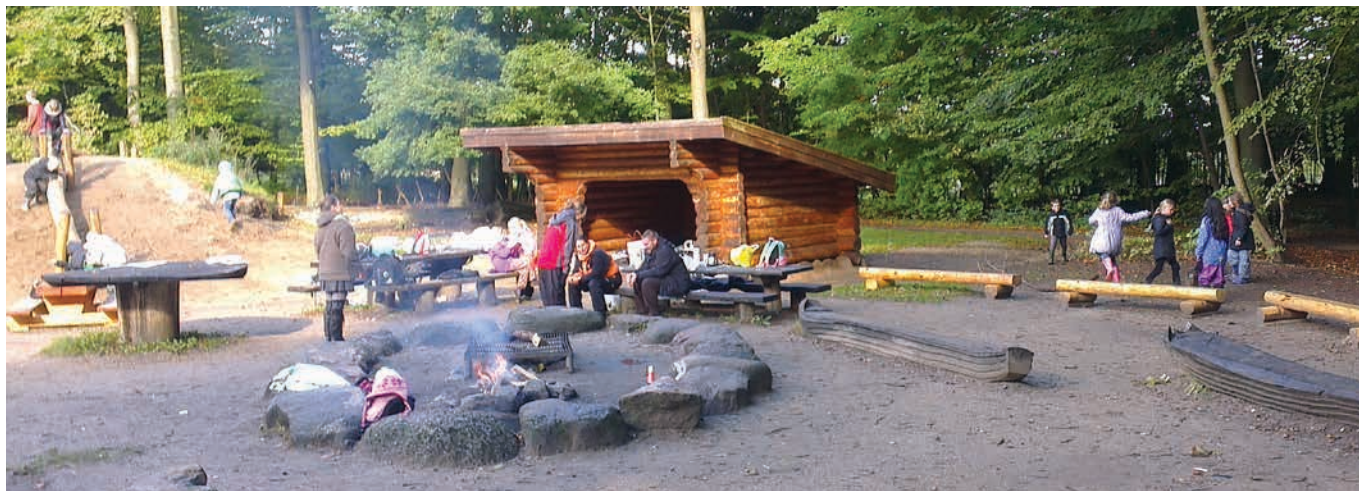
Figur 10. Eksempel på shelter på en legeplads (Egehjorten ved Hillerød). Her har børnehavens personale indtaget en af bålpladserne og et shelter som 'hjemsted'.