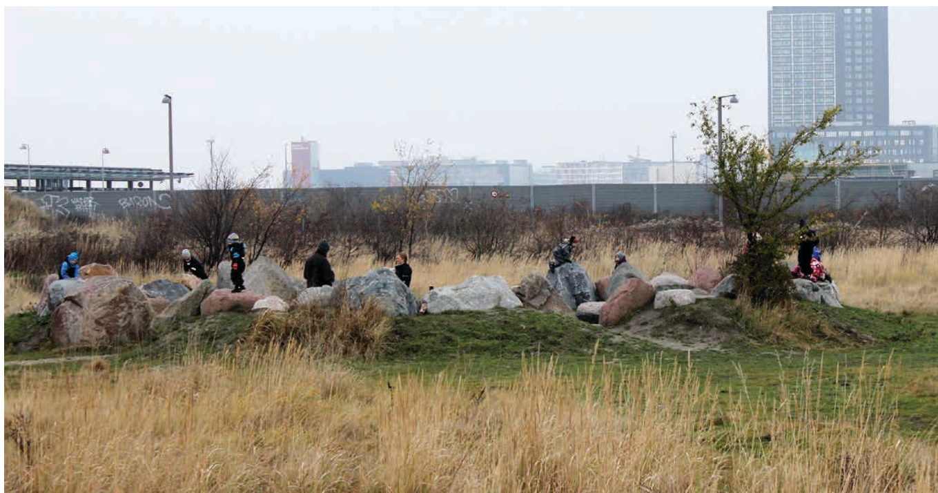
Figur 33. Runddysse på Amager Fælled med bålplads, samlingsområde og klatrelege for børnehavebørn.

at de bliver brugt til brænde på bålet. Det løse materiale fungerer derfor bedst på bemandede legeplader.