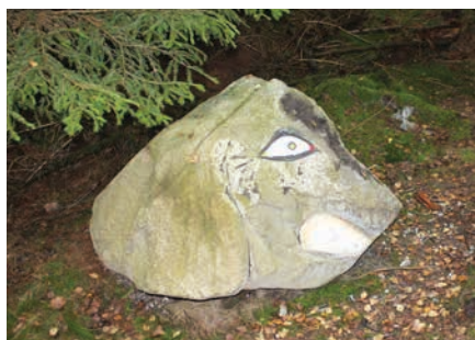
Figur 28. Eksempel på skulptur der kan lede hen imod udposter eller satellitter rundt omkring i skoven.