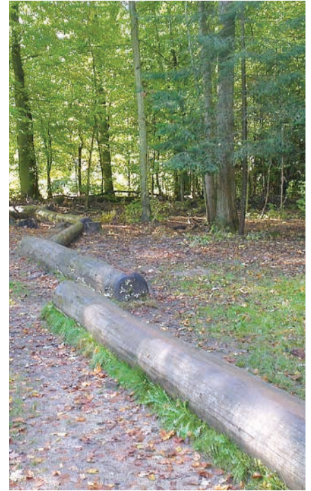
Figur 32. Eksempler på balancefaciliteter.