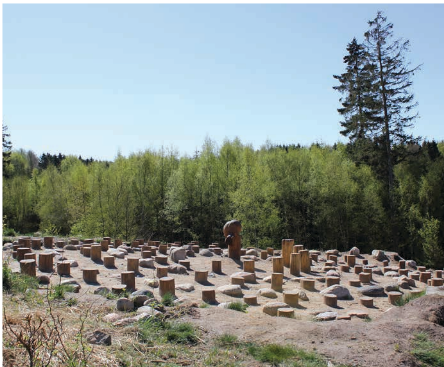
Figur 31. Klatrefacilitet, der er udfordrende for både børn, unge og voksne.