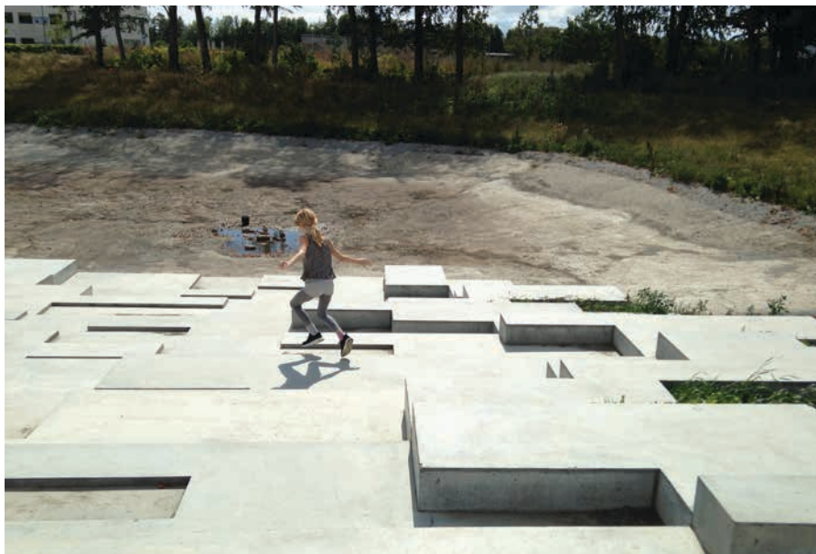
Figur 25. Overløbsbassin, der fungerer som legetrappe. Når det har regnet, bliver det i stedet et vandhul.

Et stort udviklingsprogram – Vandplus 2 – er sat i gang af Lokale- og Anlægsfonden i samarbejde med Realdania, som skal videreudvikle sådanne synergieffekter mellem regnvandshåndtering og bl.a. leg.