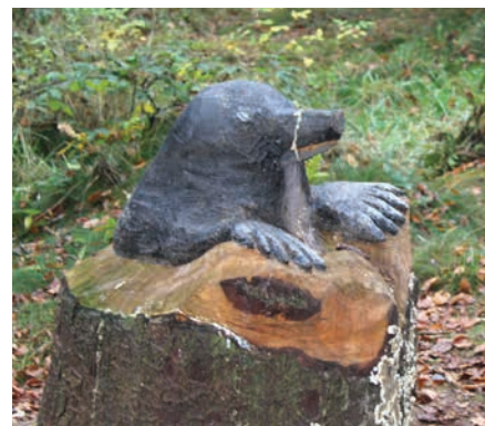
Figur 12. Skulptur af muldvarpen. Den skal både inspirere til fortælling gennem eventyret om Tommelise, og samtidig inspirere til sanslege der omhandler muldvarpens syn.

De nedfældede sorte sten, plader med spor af grævling, ræv, fasan og pindsvin på figur 14 kan understøtte nysgerrighed. De nedfældede sorte sten med spor findes på Myrthuegård ved Esbjerg. Sporene står meget klart på den blanke, sorte baggrund, og de kan