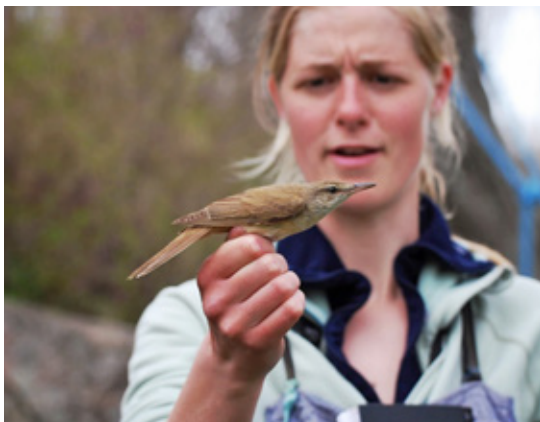
Drosselrørsanger, Christiansø, 9. maj 2013.

Ud over skarv er der blandt ikke-spurvefuglene ringmærket rekord mange af arterne skestork (50, tidl. rekorder er 31 & 20 fra 2012 & 2009), sortgrå ryle (49, tidl. rekorder er 42 & 33 fra 1999 & 2012), huldue (307, tidl. rekorder er 239 & 217 fra 2011 & 2012) samt stor flagspætte (326, tidl. rekord er 247 fra 1972).