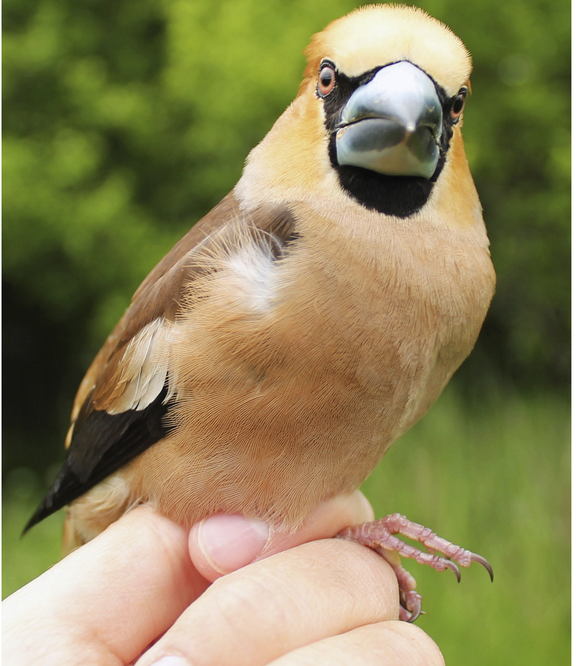
Kernebidder, Gedser, 28. maj 2013.