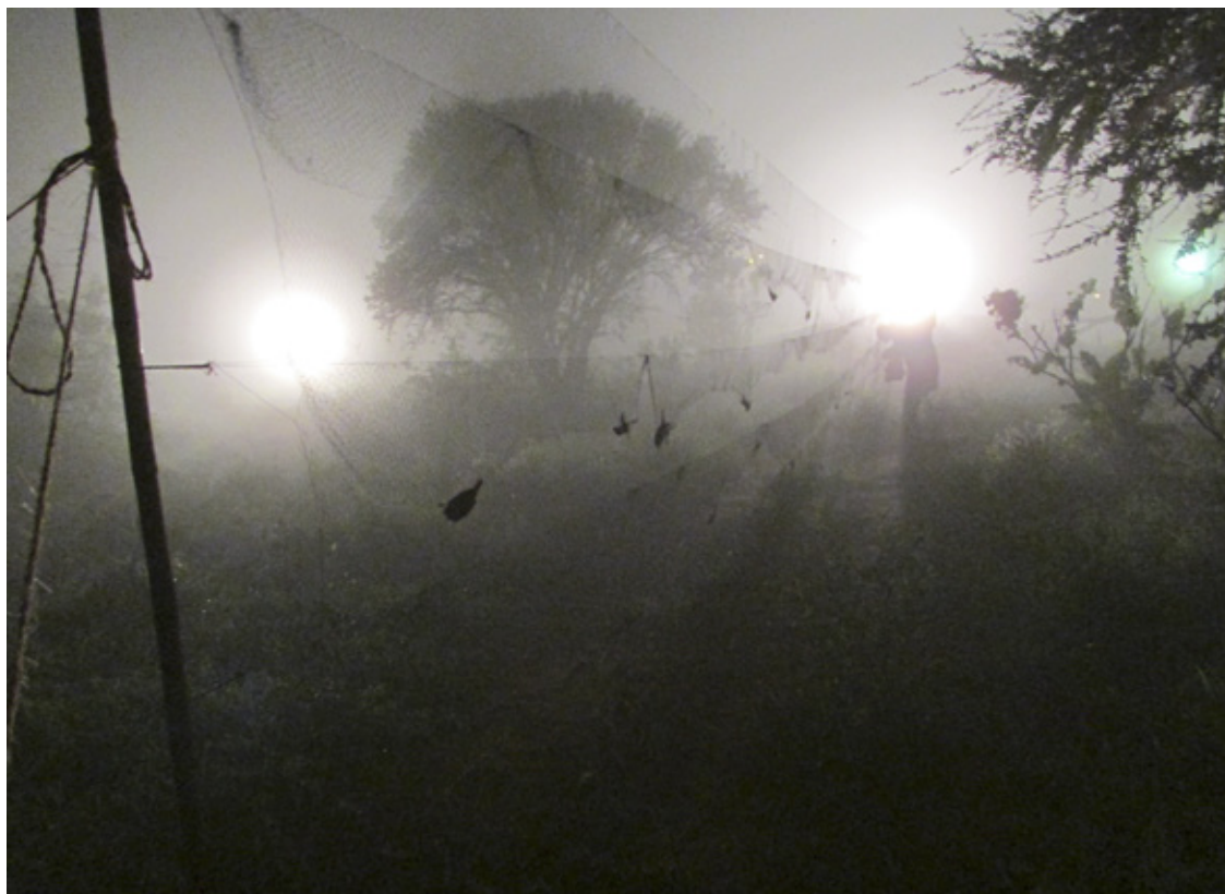
Ringmærkning om natten ved Ngulia Lodge, 6. december 2013.

Til sidst vil Ringmærkningscentralen gerne benytte lejligheden til at takke alle vore ringmærkere for indsatsen i 2013, samt takke alle der på den ene eller anden måde har bistået ringmærkningen i 2013.