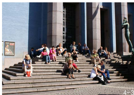
图4-1 常规座椅(北京后海) 图4-2 可移动座椅(法国巴黎) 图4-3 辅助座椅(瑞典斯德哥尔摩)

的视线等。在他看来，如何为市民在公共空间中提供高质量的座椅，如何避免或者减弱气候或外界环境对坐歇空间带来的不利影响，是公共空间设计中必须关注的问题。盖尔有关高质量坐歇空间设计与营造的思想可以概括为4个方面，即座位数量的确定、座位材质的选择、座位位置的安排和视野景观的营造。