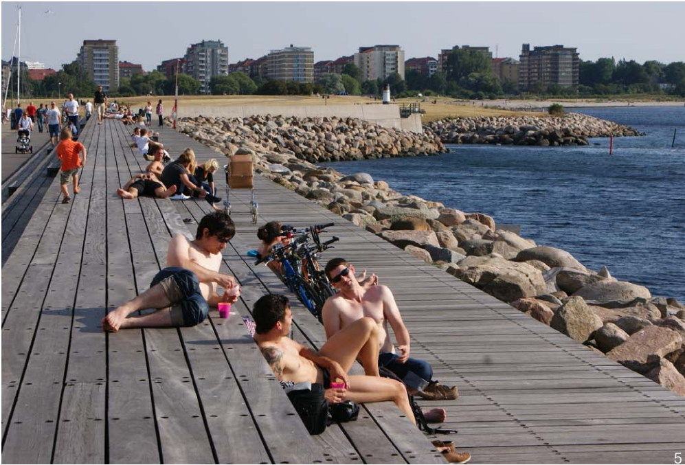
图5 舒适、美观、互不影响、有景可看(瑞典马尔默BO01社区)