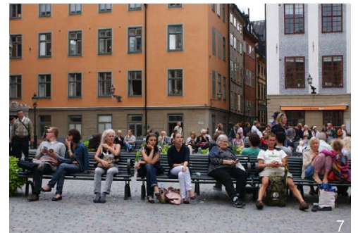
图7 70%座椅利用率的状态(瑞典斯德哥尔摩)

利用气候的因素,以满足不同人的不同需求。例如,在夏季有人喜欢晒太阳,有人需要遮阳;这样在布置座椅时既要有放在阳光下、草地上的,也要有设置在树荫下的(图5)。