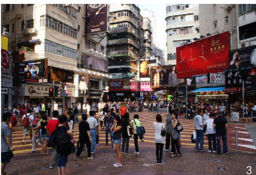
图1 人们喜欢在边缘停留(北京天安门广场) 图2 壁龛效应(哈尔滨市南岗商业区) 图3 丰富的界面使空间充满活力(中国香港)

留的地方时，通常会选择空间的边界地带” [1] ，如花池、绿篱或建筑物的边缘。他认为，这些边缘区域之所以易受青睐，首先是因为它不会妨碍其他人的通行；其次既可以为驻足者提供较佳的观察空间视角，还可以给自己带来心理上的安全感；再次也为随时离开提供了便利。在驻足空间的边缘，视线可以观察到整个空间内正在发生的事情。同时，边缘往往又是2个不同空间之间的过渡区域，可以使人们很容易地转换关注的视域。因此，从设计的角度说，无论是出于空间组织与分割的需要，还是营造景观的需要，处理好空间边缘都是十分必要的。在空间边缘处理时，应把握好2个空间之间开敞与私密的关系，这对促进活动的发生与展开是极为重要的。在多数情况下开敞空间总是比封闭空间更受欢迎，更容易使人感觉舒适。故此，在进行公共空间设计时，充分利用边缘所带来的积极效应，就会为丰富和活跃公共生活带来良好的效果(图1)。