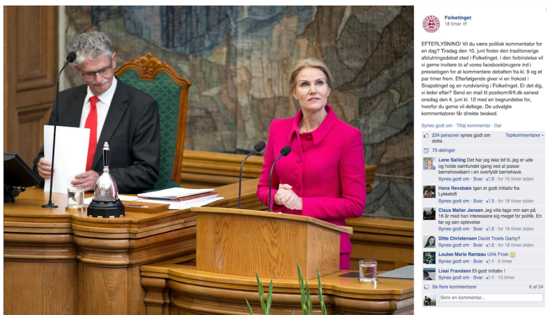
Fra Folketingets facebookside, som varetages af Folketingets administration.

gimmick, hvor alle pludselig kan være politiske kommentatorer, eller også skal det ses som en bevidst og tiltrængt udfordring af rollen?