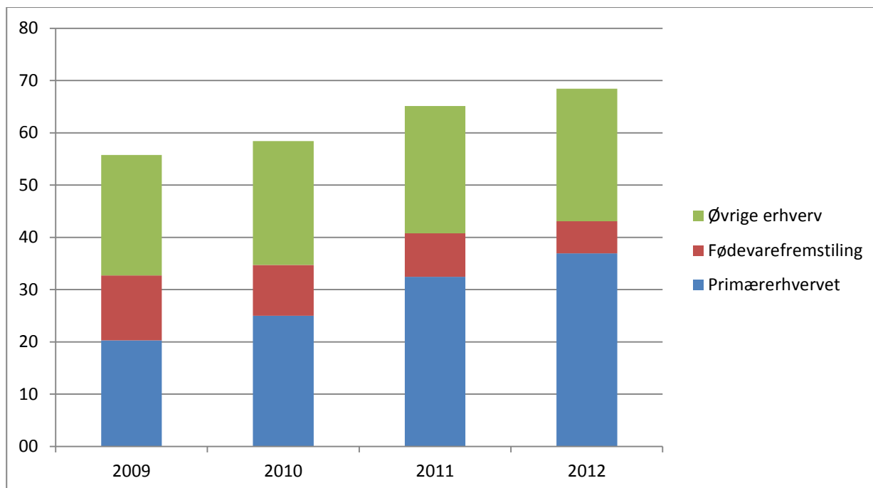
Figur 2. Bruttofaktorindkomsten i det landbrugs- og fiskeriindustrielle kompleks, mia. kr.