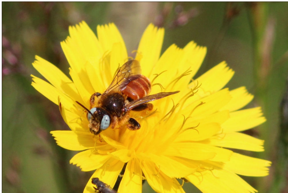
Fig. 2. Han af pragtbien Epeoloides coecutiens (Fabricius, 1775) ved Frøslev Mose (SJ). 22.VII.2012.

Biologi: Begge danske fundsteder ligger tæt på kysten. Ved Dynt Mark blev arten fundet på skvalderkål ( Aegopodium podagraria ), der groede ved et levende hegn umiddelbart inden for Gammelmark klinten. Halk Skydeterræn, der er en del af Natura 2000 område nr. 112 (Naturstyrelsen, 2013), ligger lidt nordligere i Sønderjylland, lige ud til Lillebælt. Begge lokaliteter må betragtes som gode findesteder for bier. Ved fem ture til Dynt Mark 2006-2011 er registreret 54 arter af solitære bier ud over Andrena synadelpha ,