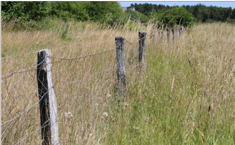
Fig 5. Hegnspæle af flækkede egestammer ved Davinde-Tarup grusgrave (F). Foto: Henning Bang Madsen 09.VII.2013.

Female Heriades truncorum (Linnaeus, 1758) at nest-entrance in fence post of oak trunk by Davinde-Tarup gravel pits (F). Photo: Henning Bang Madsen 09.VII.2013.