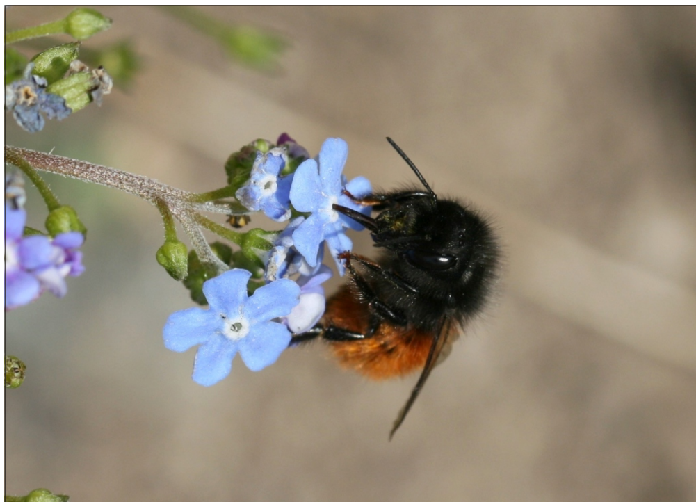
Fig. 3. Hun af murerbien Osmia cornuta (Latreille, 1805) på kærmindesøster ( Brunnera macrophylla ). Odense (F). Foto: Anni Lene Nielsen 21.IV.2013.

Ved brug af nøglen i Scheuchl (2006) kommer man ligeledes uproblematisk til arten, især ved hanner, hvor det er første art der nøgles ud til. Her vælges antenne længere end thorax, samt thorax med gråsort behåring. Hunnerne nøgles i Scheuchl (2006) ud som første art relevant for Danmark, idet der vælges clypeus med fremstående »horn«.