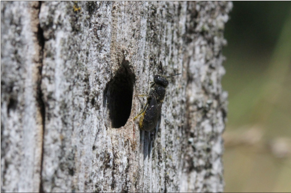
Fig 4. Heriades truncorum (Linnaeus, 1758) hun ved redehul i hegnspæl af flækket egestamme ved Davinde-Tarup grusgrave (F). Foto: Henning Bang Madsen 09.VII.2013.

Female Heriades truncorum (Linnaeus, 1758) at nest-entrance in fence post of oak trunk by Davinde-Tarup gravel pits (F). Photo: Henning Bang Madsen 09.VII.2013.