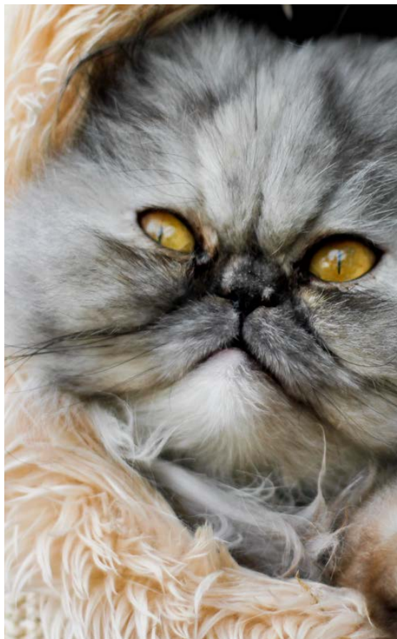
PERSERKAT. Katte af denne race er fremavlet med meget flade ansigter. Dette giver anledning til en række velfærdsproblemer – ikke mindst i form af besværet vejtrækning. Ifølge en spørgeskemaundersøgelse fra 2012 angav 87 % af de praktiserende dyrlæger, der havde perserkatte og andre katte med flade ansigter som patienter, at de havde kendskab til vejtrækningsproblemer hos disse katte, og 25 % angav, at forsnævrede næsebor og vejtrækningsproblemer var hyppigt forekommende.