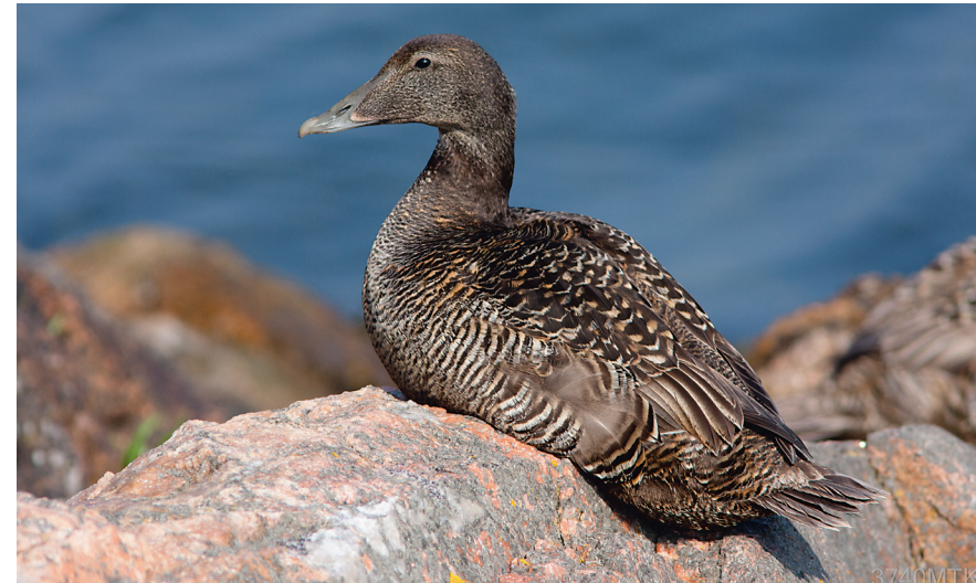
Figur 2: Ederfugle-hun skuer ud over Østersøens vande

Figur 1: Ederfugle-ællinger på Christiansø gør sig klar til overfarten.