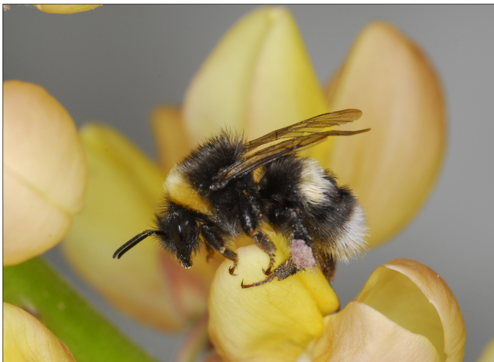
Fig. 1. Arbejder af Bombus lucorum (Linnaeus, 1761) på lupin ( Lupinus sp.) ved Runavík, Eysturoy, Færøerne. Foto: Jens-Kjeld Jensen, 28.VII.2011.

Jens-Kjeld Jensen har igennem en lang årrække indsamlet og registreret insekter fra alle de 18 færøske øer (Jensen, 2001; Jensen, 2009; Jensen & Sivertsen, 2010; Tolsgaard & Jensen 2010). Efter et enkeltstående fund i 1887, blev humlebier første gang igen registreret i 2007. Ynglende humlebier blev først set i 2010. En egentlig eftersøgning af humlebier har ikke fundet sted før 2010, men da humlebier er markante og karismatiske insekter, er de næppe tidligere blevet overset. For at sikre så mange nye oplysninger som muligt, blev en efterlysning om observationer af humlebier bragt i færøske tv-udsendelser i 2010 og 2012, samt i radioen i 2011. For at beskytte de små bestande af begge arter, er kun et enkelt levende eksemplar blevet indsamlet som belæg. Alle øvrige indsamlinger var af døde eller døende individer. Data til nærværende artikel er primært baseret på observationer, hvoraf flere er dokumenteret ved fotos. En liste med alle observationer findes som appendiks sidst i artiklen. De indsamlede humlebier opbevares på Zoologisk Museum, København og på Føroya Náttúrugripasavn, Tórshavn, samt hos J-K. Jensen.