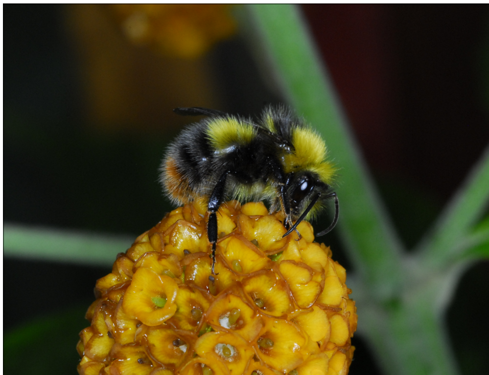
Fig. 4 Han af Bombus pratorum (Linnaeus, 1761) på sommerfuglebusk ( Buddleia globosa ) ved Signabøur, Streymoy, Færøerne. 05.VII.2010.

Med spredning af den først etablerede art, Bombus pratorum (Linnaeus, 1761), til endnu en bygd, ligger det klart at denne art trives i det færøske klima. Foråret 2012 var meget koldt og tørt, og antallet af individer i yngleområdet var derfor lavere i 2012, i forhold til de to foregående år. Trods det dårligere vejr, var der alligevel mange observationer i sæsonen 2012 (se appendiks nedenfor). Det synes på den baggrund derfor sikkert at arten vil kunne klare sig fremover. Det er naturligt med fluktuationer i antallet af individer hen over årene. Lignende forhold ses fra Danmark, hvor primært en meget fugtig sommer ofte fører til et lavere individantal det følgende år. Flyveperioden for arten er længere på Færøerne end i Danmark, fra sidst i april til hen i september. I Danmark har arten i reglen afsluttet sæsonen allerede i juni måned. Forskellen kan formentlig tilskrives klimaet, der er køligere på Færøerne, men lyset kan muligvis også spille ind: Øernes nordlige beliggenhed giver lange lyse døgn i sommermånederne og biernes aktivitetsperiode over døgnnet vil forlænges, hvis nedbør og blæst ellers ikke forhindrer dem i at indsamle pollen og nektar. Humlebier er mest aktive på varme og solrige dage, som der imidlertid ikke er mange af i det kølige færøske klima. Men humlebier kan også fly-