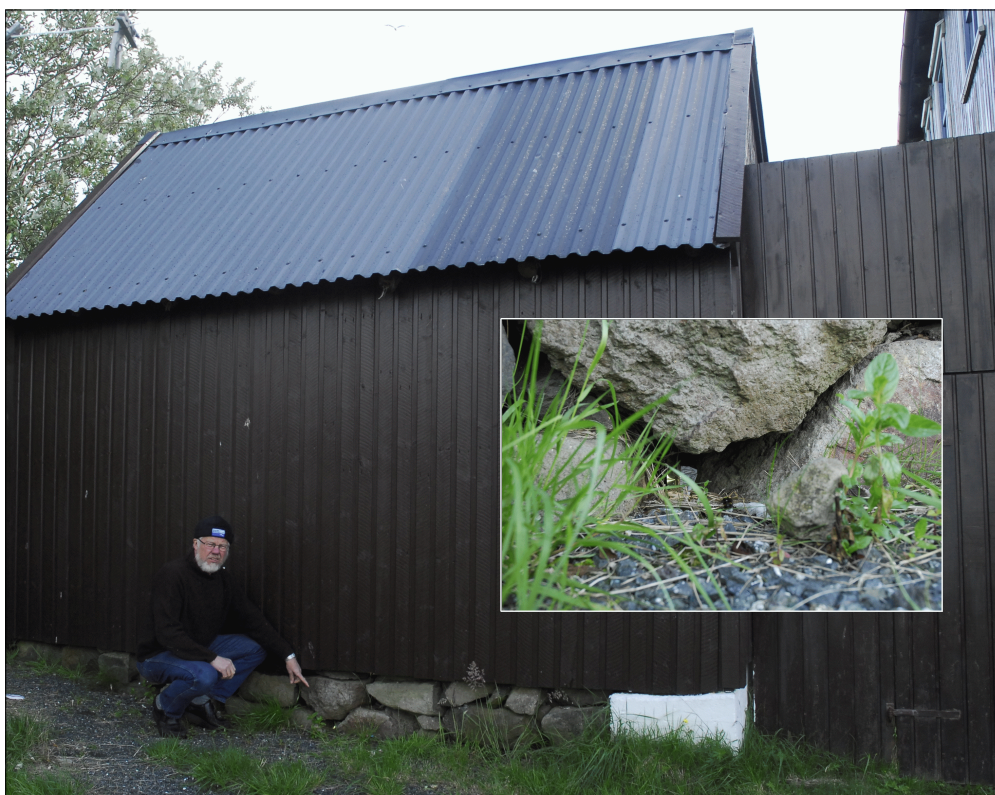
Fig. 3. Første fund af et humlebi-bo på Færøerne. Leitisvegur 101, Runavík, Eysturoy. Indsat foto af indflyvnings-hullet. Foto: Marita Gulkleit, 25.VIII.2012.

Det er nok ikke helt tilfældigt, at området omkring Skálafjørður blev det andet yngleområde for humlebieer på Færøerne (se kort, Fig. 2). Der findes talrige store haver med mange blomstrende planter i området, og der bliver løbende plantet nye importerede planter, hvorved bl.a. humlebieer kan blive indslæbt. Det først kendte eksemplar af Bombus lucorum (Linnaeus, 1761) fra Færøerne var en dronning, indsamlet i 2007 fra netop