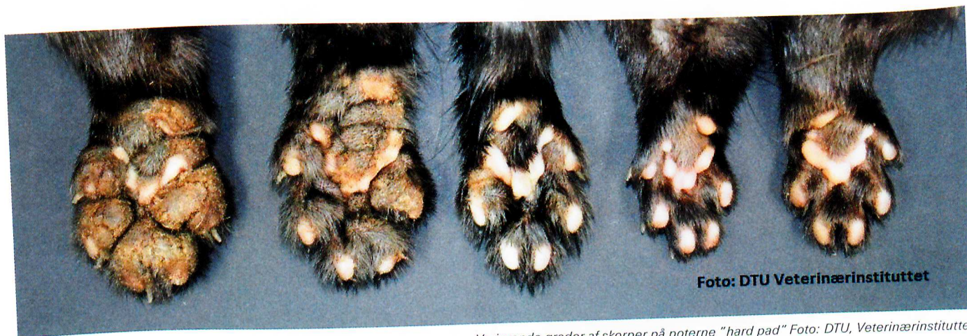
Variierende grader af skorper på poterne "hard pad"

HVALPESYGE BETRAGTES SOM EN AF DE ALVORLIGSTE INFEKTIONSSYGDOMME HOS VILDTLEVENDE ROVDYR.