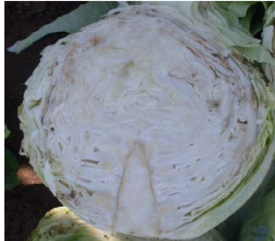
Figure 7. Sintomas sistêmicos da podridão negra: planta saudável (esquerda); decoloração castanha (ou preta) no caule do repolho que se estende em algumas folhas internas (direita)