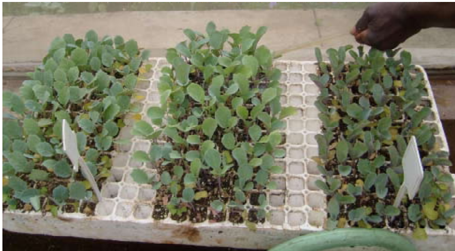
Figure 9. Método de detecção directa do patógeno "Growing on method"

Detecção directa consiste em identificar o patógeno sem que primeiro seja isolado e purificado. Métodos de detecção directa não requer muito conhecimento técnico, mas em geral levam muito tempo e são inconclusivos (Schaad, et al., 2001). O método de detecção directa mais usado é o de sementeira directa da semente "growing on test", no qual semeia-se a semente e de quando em vez vai-se inspecionando a manifestação dos sintomas nas plantas germinadas. (Fig. 9)