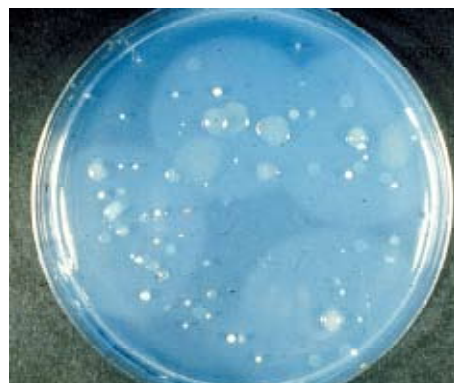
Figure 10. Método de detecção: Inoculação directa da semente no meio de cultura SX agar (esquerda) e inoculação do extracto da semente no meio de cultura FS agar (direita)