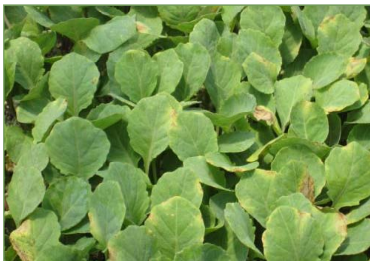
Figure 5. Cloroses e necroses foliares no viveiro de repolho