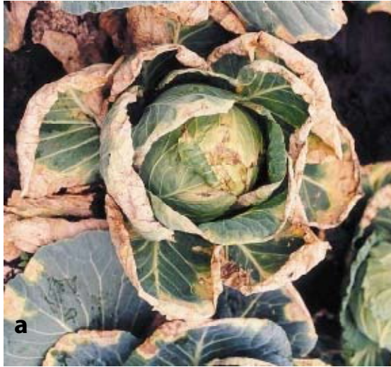
Figure 6a. Necroses foliares em forma de V