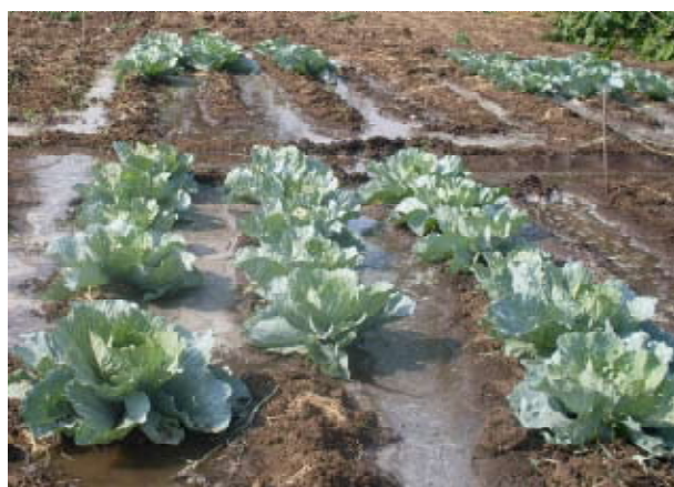
Figure 3. Campos de repolho sob rega por gravidade no distrito de Chókwè

Em Moçambique o repolho é cultivado ao longo de todo ano. Contudo devido a sua elevada susceptibilidade ao ataque pela Xanthomonas campestris pv. campestris causador da podridão negra e da traça da couve ( Plutela xylostela ) na época quente e chuvosa, é geralmente feito na época fresca e seca, entre Março e Agosto. Em geral, na preparação dos viveiros a rega é por regador manual, enquanto que nos campos é por gravidade (Fig. 3).