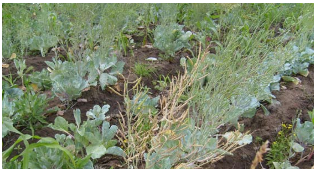
Figure 2. Produção da semente de couve Tronchuda Portuguesa generalment associada a elevada incidência da podridão negra em Moçambique