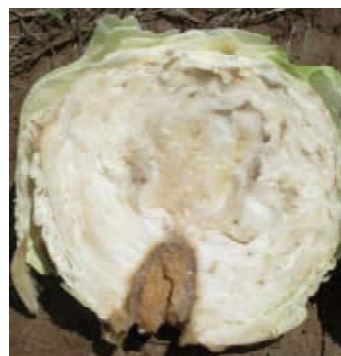
Figure 8. Sintomas da podridão mole causada por Pectobacterium carotovorum subsp. carotovorum