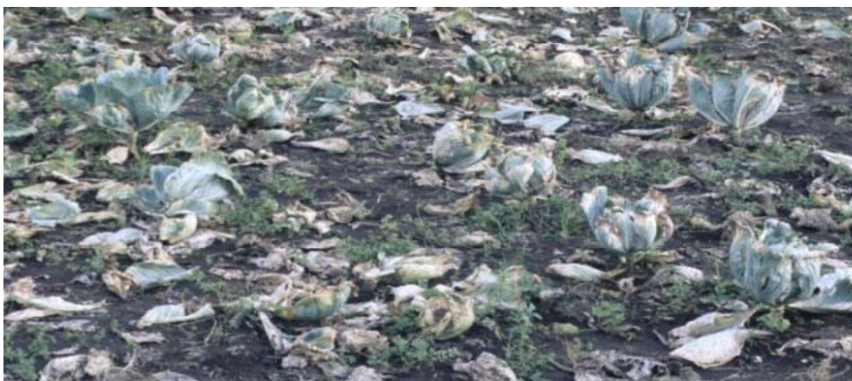
Figure 1. Perdas na ordem dos 100% devido a podridão negra em Boane

A produção de semente nos trópicos esta geralmente associada a elevada incidência, sendo a semente a fonte de inoculo primário. Semente contaminada e ou infectada pela doença é uma das mais importantes fontes de inoculo. Com efeito, apenas uma semente infectada num universo de 10, 000 sementes testadas num lote, é considerado um limiar aceitável, mas tolerância zero deve ser observada na produção de repolho a partir de viveiro (Schaad, 1982; ISTA, 2007).