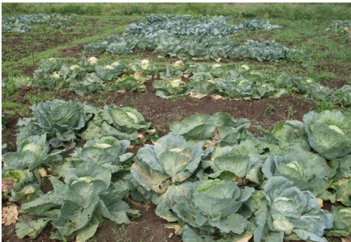
Figure 11. Ensaio de campo mostrando variabilidade das diferentes variedades no concernente a tolerância a podridão negra das Brassicas.

O uso de variedades resistentes ou tolerantes a PNC, onde quer que estejam comercialmente disponíveis, foi desde sempre reconhecido como sendo uma boa estratégia de manejo da doença. Levantamentos de campo acompanhados de inquéritos aos agricultores, constataram que as variedades normalmente produzidas pelos agricultores são: Copenhagen market, Gloria F1, Gloria of Enkhuizen, Star 3308, Star 3317, Drumhead, Tropicana e Conquistador. Para melhor recomendar aos produtores estas variedades foram submetidas aos ensaios de campo na Estação Agrária de Chókwè em duas épocas consecutivas. Importa lembrar que a doença é favorecida por períodos quentes e chuvosos. De salientar que na época fresca e seca (de Março – Agosto) os agricultores não correm muitos riscos de perdas devido a doença, independentemente das suas opções em termos de variedade. Contudo na época chuvosa e quente as variedades Conquistador, Tropicana e Star 3308 demonstraram ser relativamente tolerantes em relação às outras (Fig. 11).