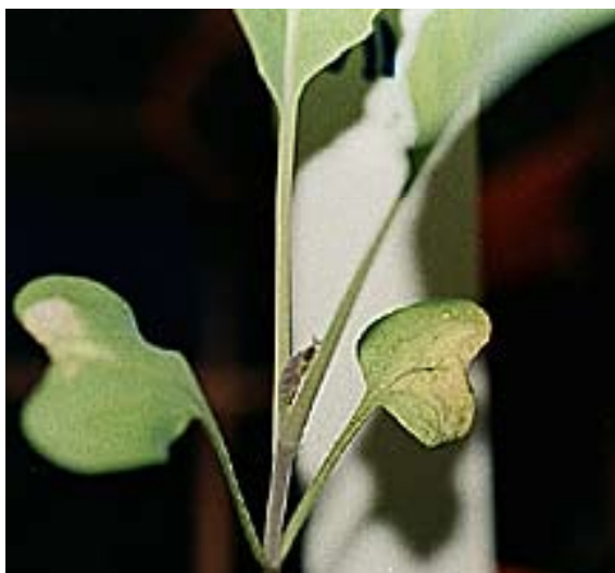
Figure 4. Necroses em forma de V nos cotilédones infectados com a PNC

As plantas podem ser infectadas pelo Patógeno Xcc em qualquer estágio do seu crescimento. Nas plântulas a infeção começa por necroses negras nas margens dos cotilédones (Fig. 4). Com a progressão da doença os cotilédones secam e caem. Com infeção severa no viveiro, as plântulas apresentam cloroses a necroses podendo murchar (Fig.5).