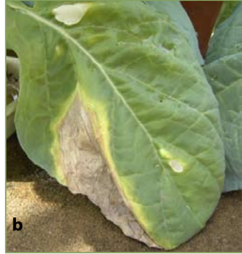
Figure 6b. Colapso do tecido internerval em repolho

No campo, a infecção pela Xcc causa lesões foliares cloróticas a necróticas começando a partir das margens em em forma de V com o vértice voltado para a base da folha (Fig. 6a & b), descoloração vascular preta a castanha (Fig. 7), paralisação do crescimento.