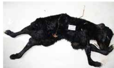
2-5 pct. af kalvene fødes med misdannelser i besætninger smittet med Schmallenbergvirus.