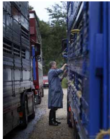
De seneste års fokus på at undgå transport af højdrægtige kreaturer har haft god effekt. Arkivfoto.

Det er den tilsynsførende dyrlæge på slagteriet, der afgør om fosteret er mere end otte måneder gammelt. Det vurderes på kalvens tænder og udviklingen af hårlaget. /Kirsten Marstal