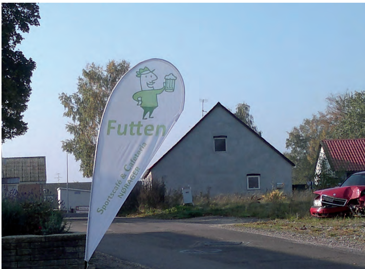
Landsbyen har fået et nyt mødested.