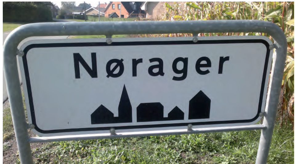
I denne landsby har unge valgt at bo og finde nye leveveje.

Måden at identificere typerne på er først og fremmest sket ved at spørge interviewpersonerne om, hvem af tre beskrevne typer, de selv syntes de mest lignede, jf. formuleringer i spørgeguiden i bilaget. Deres svar er i analysen holdt op imod deres svar på en række andre spørgsmål. Som noget af det første blev der også foretaget et check på sammenhæng mellem, hvad folk selv syntes, og hvad de strukturelle kendetegn ved dem og deres erhverv lægger op til, se tabel 7. Den gengiver pæne overensstemmelser mellem deres udsagn (subjektive opfattelser) og de objektive kendetegn ved dem og deres erhverv.