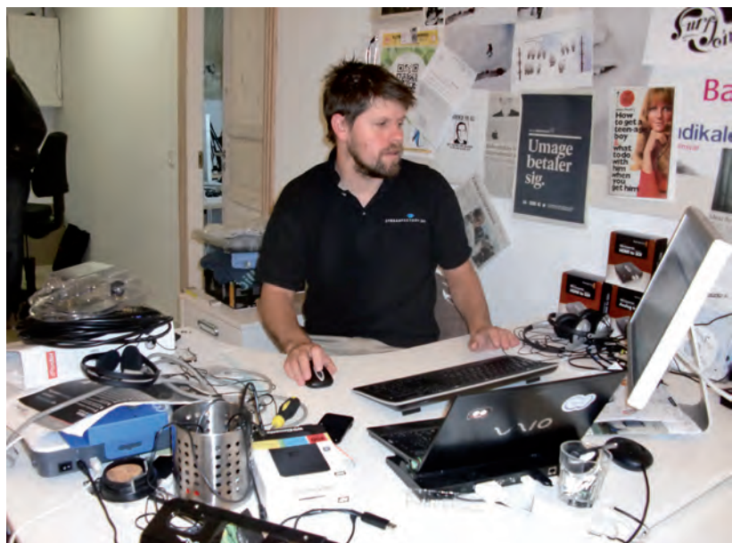
En virksomhed behøver ikke at fylde meget nu om dage

Han søger fortsat inspiration gennem det kon-