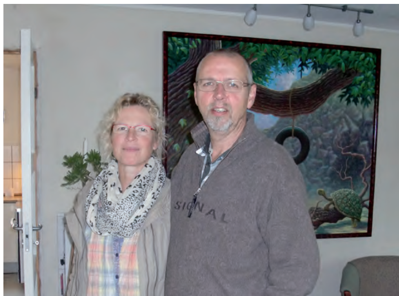
De to driver tilsammen fem nye kreative virksomheder fra bopælen.

De involverede overvejer at finde et stærkere fokus og optimere det fælles for de tre (formidling/læring/bevægelse/musik til børn i en bestemt situation og alder).