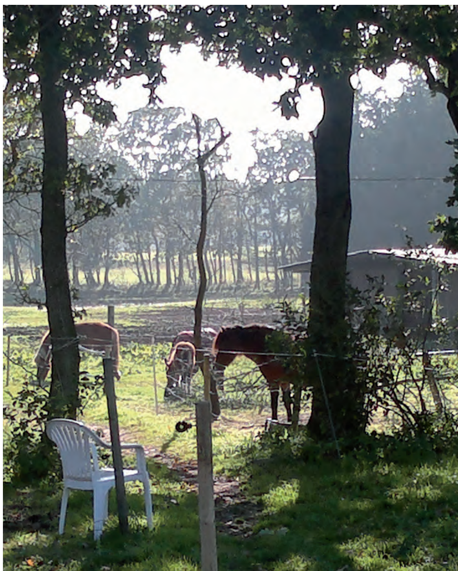
Billedet af det gode liv?