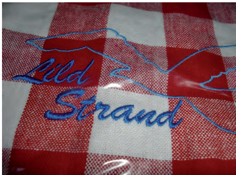
Hawhuset ligger naturligvis på Lild Strand.

AN har selv tidligere været optaget af genbrug og gruppen har i øvrigt fælles interesser i bl.a. hånd-