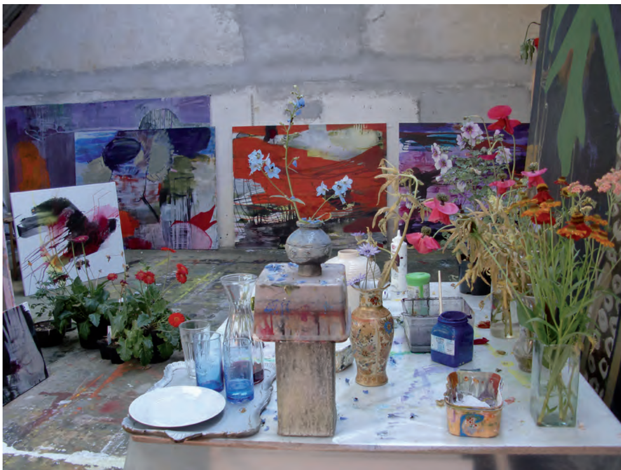
Ulla lever af at male sine blomster og naturen omkring sig.

Hun finder behov for en økonomisk buffer og om muligt understøtning og aflastning, f.eks. ved produktion af rammer til sine billeder eller til administration/drift af selve virksomheden. "Måske udvikle et netværk eller partnerskab, til deling og udveksling af services?", spurgte red.