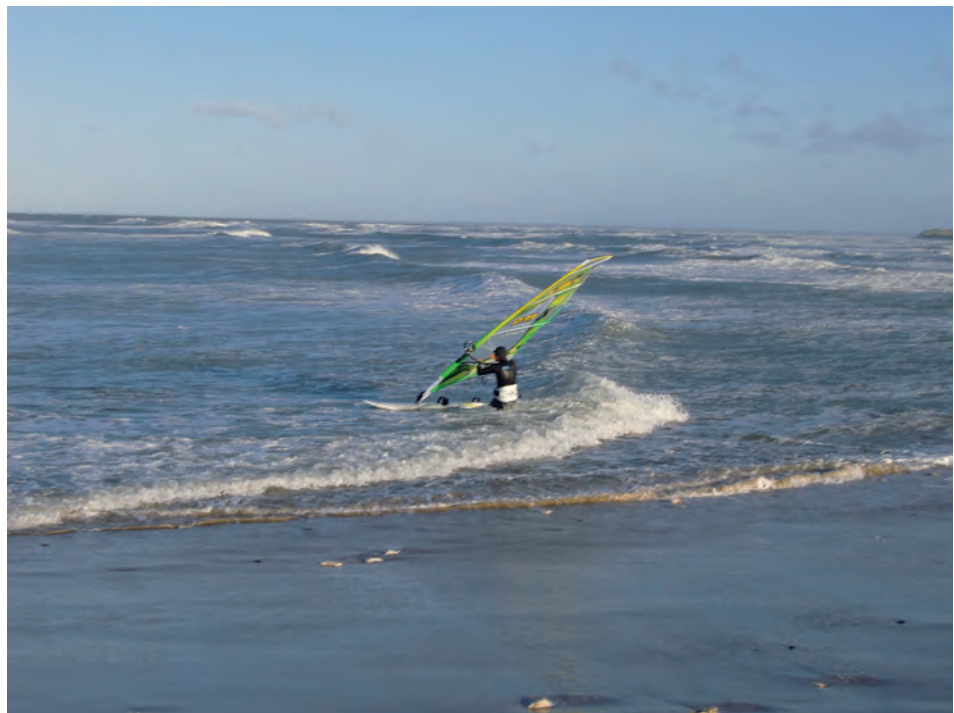
Også en iværksætter?

Det handler også om evt. forskelle, som kan relateres til den forskellige beliggenhed i landet 10 .