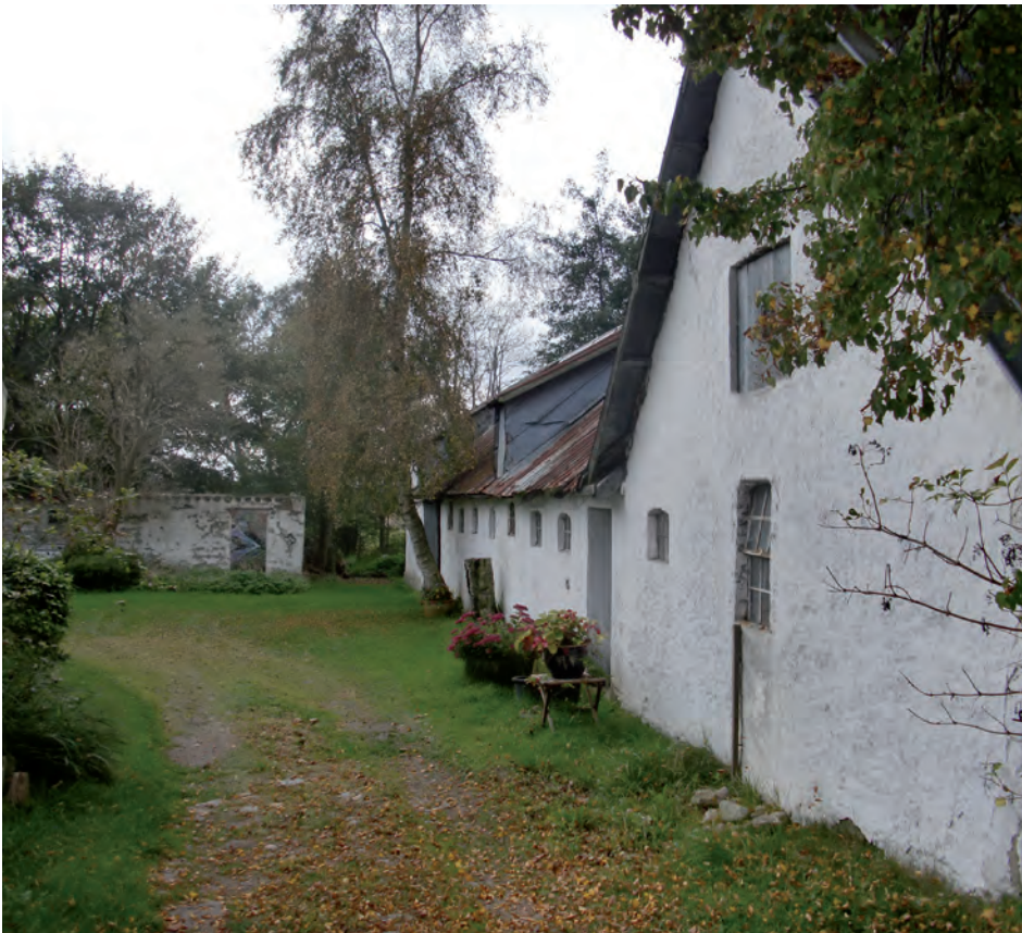
Nedlagte landbrugsejendomme er et mekka for nye typer iværksættere.