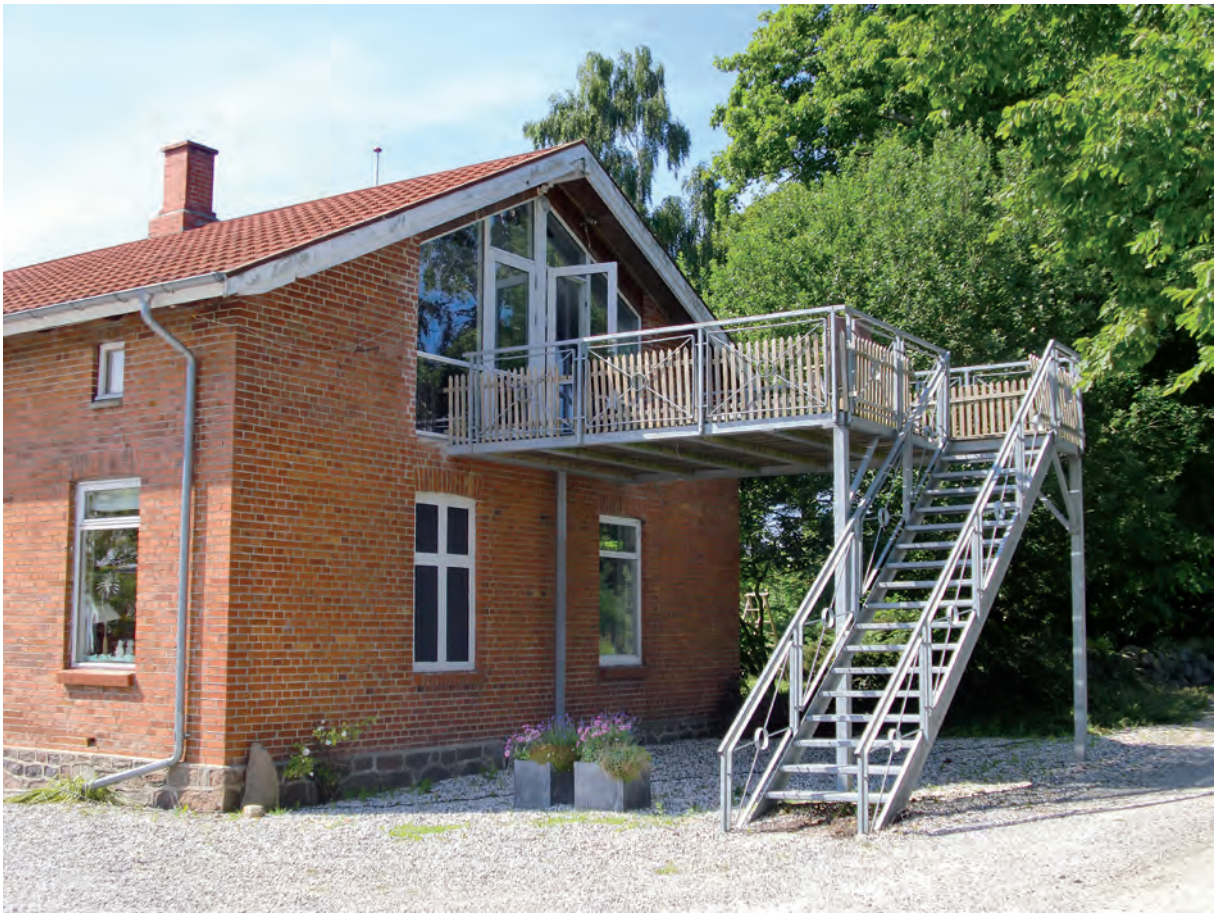
EGLU AIS har domicil på 1. sal i den nedlagte landbrugsejendom for enden af grusvejen.

JO kender også til Djurslands Udviklingsråd og til LAG Djursland, men har ingen direkte relationer.