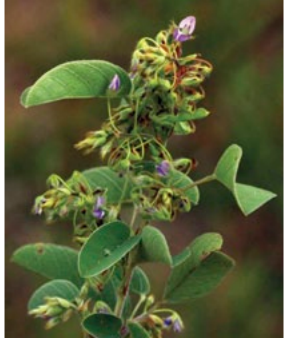
Mange afrikanske medicinplanter har sammentrækkende virkning på livmoderen. Til venstre ses Commelina africana og til højre Desmodium barbatum .

Men virker planterne? Det vil vi gerne finde ud af. I programmet People and Plant Medicine undersøger vi derfor videnskabeligt, om de planter, som traditionelle healere rundt omkring i verden anvender, rent faktisk har farmakologiske virkninger, som gør planterne egnede som medicin. Ud over at identificere de planter som virker, er det også vigtigt at få sorteret virkningsløse eller direkte skadelige planter fra.