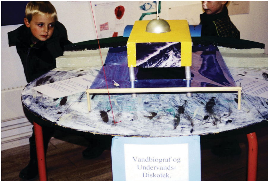
Fremtidsværkstedets utopifase: Et visionært bud på en vandbiograf med undervandsdiskotek i Nykøbing Sjællands havn.