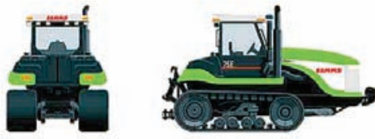
Figur 7-4. Larvefodstraktor, her Claas Challenger, der vejer 15 tons.

Man kan spare helt op til 70 % af brændstoffet ved at gå fra almindelige maskiner, der kører hen over jorden, til maskiner, der kører på en form for skinner. Denne besparelse er opnået ved overfladisk pløjning uden dybdeløsninger. På denne baggrund kan man konkludere, at 80-90% af den energi, der bruges med traditionelle maskiner, går til at genoprette skader forårsaget af maskinerne selv. Hvis vi kan finde metoder til at ned sætte strukturskaderne på jorden, vil en betragtelig del af energiforbruget falde væk.