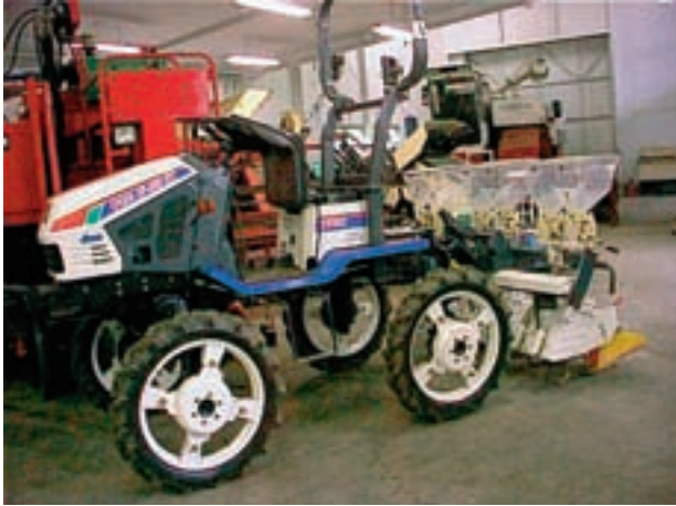
Figur 7-6. Den japanske rismarkstraktor.