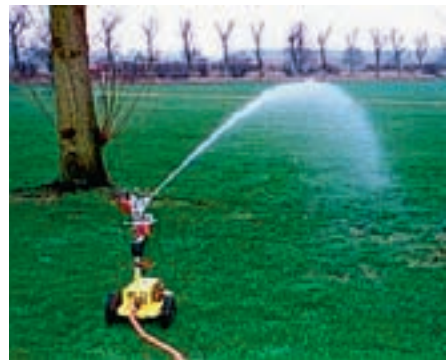
Figur 7-8. Prototype af en autonom vandingsrobot.

Et autonomt vandingsssystem vil være udstyret med en præcisionstildeler (figur 7-8) kombineret med en vanddeficitmo-