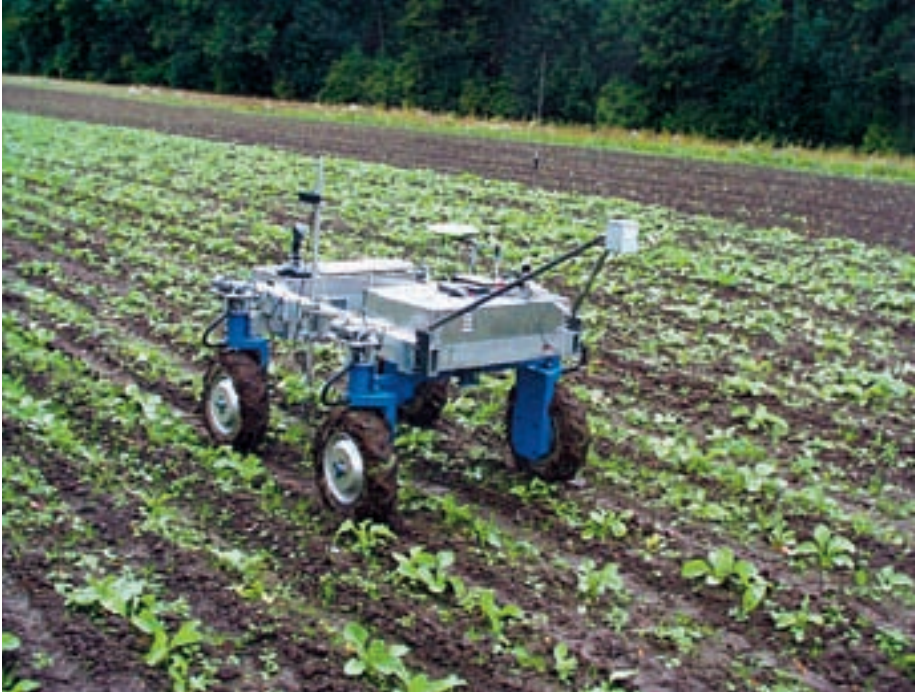
Figur 7-7. Prototype af en autonom lugemaskine.

Oplysninger om ukrudtets vækst – eller et skadedyrs udvikling – kunne opsamles, således at MIS-systemet kunne udsende en advarsel, når en skadetærskel evt. blev overskredet. Et sådan projekt er allerede under udvikling i Danmark.