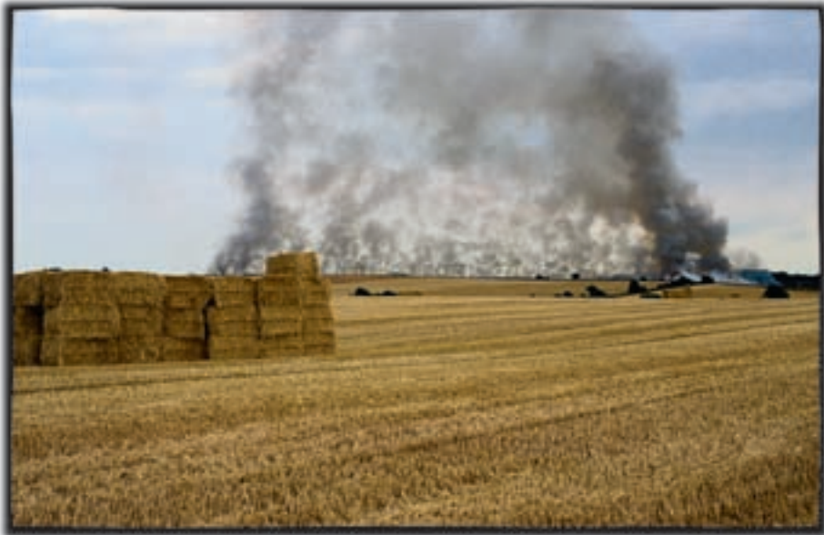
Figur 7-2. Selvom der umiddelbart ser meget ensartet ud, kan der sagtens være store forskelle i tekstur, næringsindhold, fugtighed og meget andet på en mark som denne.

Før dampmaskinen og dieselmotoren blev landbrug drevet i små enheder. I takt med mekaniseringen blev bedrifterne større, og i dag har vi økonomiske kræfter, der presser bedriftsstørrelserne endnu højere samtidig med at antallet af beskæftigede falder. Det betyder at fra at skulle drive nogle få tønder land (det areal, en hest kan pløje på en enkelt dag) skal driftlederen i dag klare tusinder af hektarer. Når landbrugsbedrifter når op