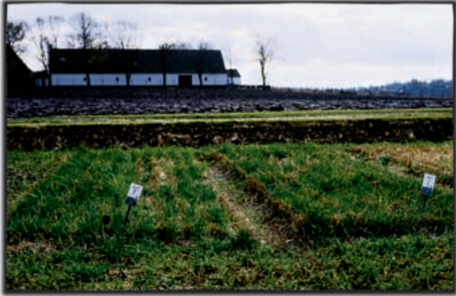
Figur 7-1. Økonomien er den primære drivkraft bag mange mindre brugs forsvinden.

dokumentation for, hvorledes de er produceret.