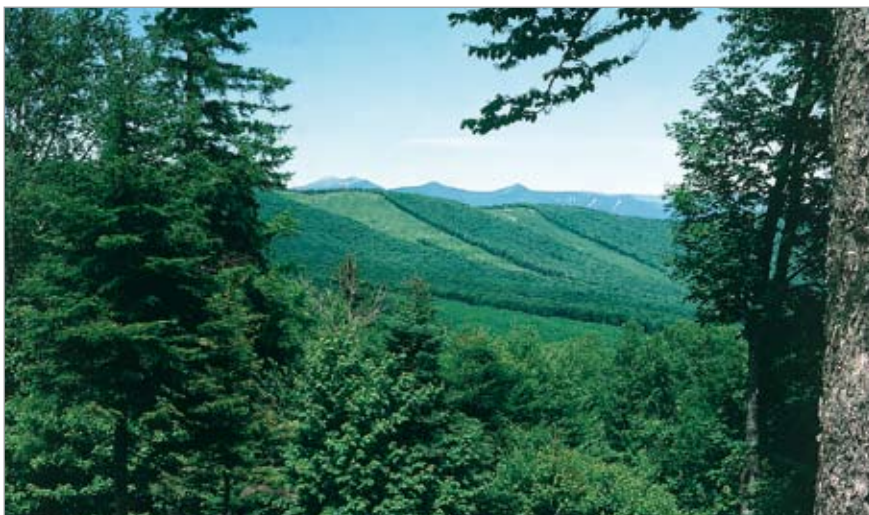
Figur 3. Det har bibragt stor videnskabelig forståelse at udføre kontrollerede økosystemeksperimenter, som her i Hubbard Brook, USA. Øverst ses afskovede og kontrol oplande på afstand. Nedenfor til venstre ses afløbet fra afskovet opland. Nedenfor til højre ses afløbet fra naturligt opland. Afløbet måles kontinuerligt og hyppige prøver udtages til kemisk analyse for at kunne bestemme stoftransporten.