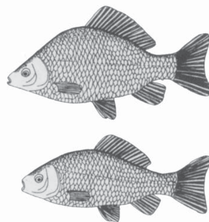
Øverst højrygget karusse og nederst lavrygget karusse.

Boks 1: Videnskabelig metodeplan. Det systematiske hierarki i en videnskabelig arbejdsplan ser sædvanligvis ud som vist til venstre. I de næste tre kolonner illustreres tre konkurrerende hypoteser om: arv (1), føde (2) og rovdyr (3), der er opstillet som mulige forklaringer på tilstedeværelse af højryggede og lavryggede karusser i søer.