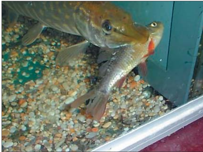
Størrelsen er afgørende for rovfishs byttefangst. Gedde har fanget skalle fra siden, men byttet må drejes og sluges på langs for at at gedden kan gabe over det.

af, at de fleste sammenhænge er komplekse, kan vi forvente, at modeller vil vinde frem på mange andre områder også uden for hidtidige kerneområder i økologi, geofysik og klimatologi. Ved fremtidige vurderinger af den humane DNA-kode og sygdomme, risikoen for naturkatastrofer, risikoen for spredning af fugleinfluenza osv., vil computermodeller uden tvivl få en stadig større anvendelse og nye fagdiscipliner vil dukke op.