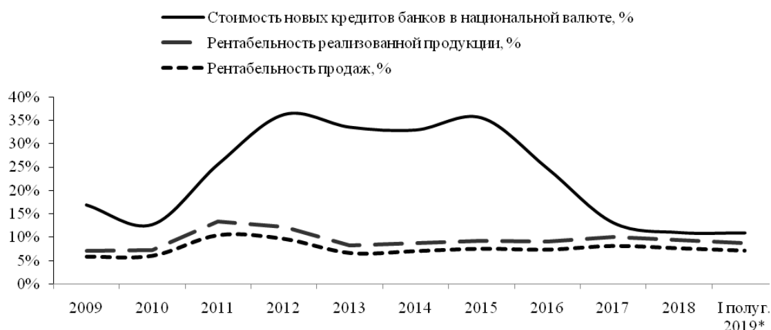
Рисунок 2. – Динамика изменения стоимости кредитов банков и уровня рентабельности организаций за 2009–2018 гг., I полугодие 2019 г.

В итоге реализация проциклической монетарной политики привела к неуправляемой кредитной экспансии на первоначальном этапе и, по сути, к ее провалу в последующее время. Закредитованность предприятий и продолжительный период сохранения чрезмерно высоких процентных ставок по кредитам и займам, кратно превосходящих уровень показателей рентабельности производственных предприятий (рис. 2), стали причиной кризиса неплатежей, который принимает «лавинообразный» разрушительный характер.