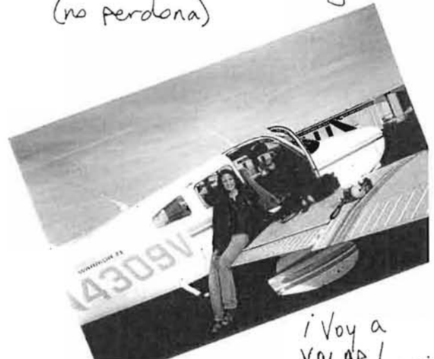
i Voy a VOLAR!.....