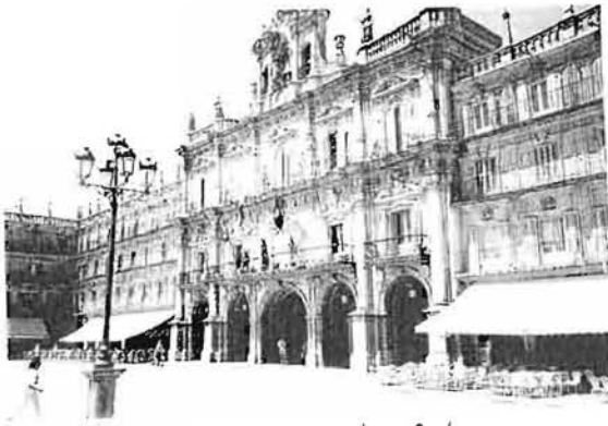
Plaza Mayor de Salamanca