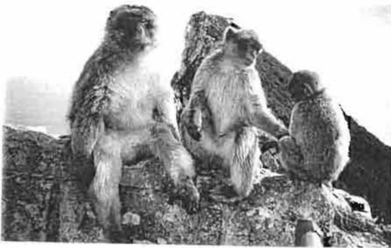
Monkeys of Gibraltar