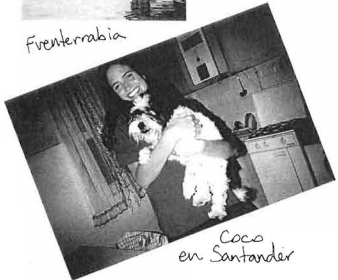
Coco en Santander