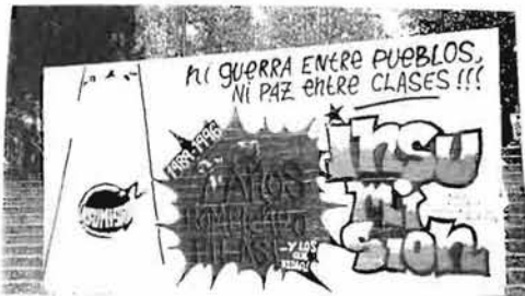
Cerca de la facultad