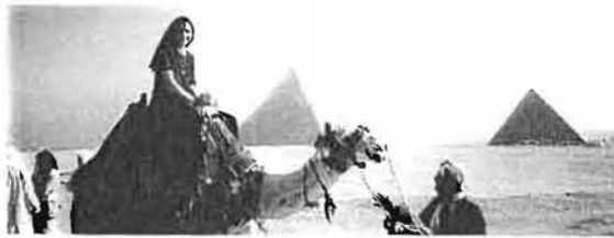
أنجي في مصر