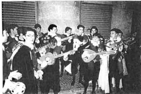
Las Tunas en Sevilla