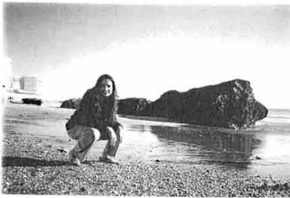
La playa de Cádiz

Radio City Productions in association with PinoSaglio Presenta