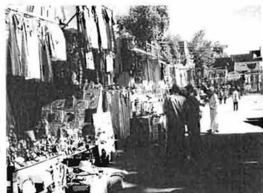
Market in Edfu