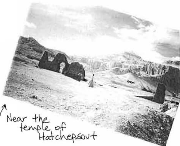
Near the temple of Hatchepsout