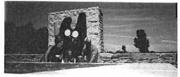
El Camino de Santiago (no perdona)