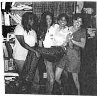
Las chicas locas