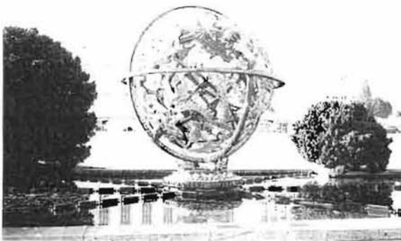
The world of united nations