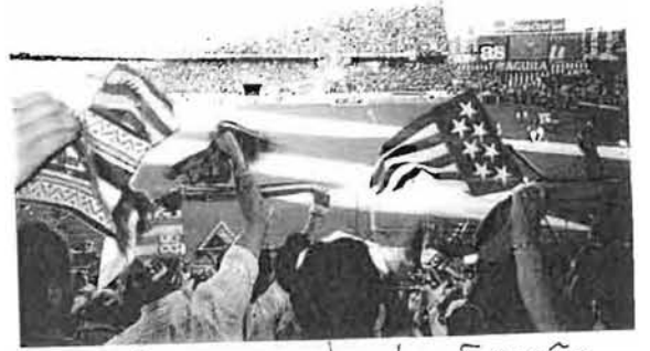
Campeonata de España