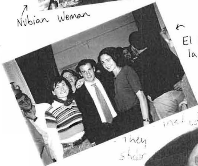
El Litri y la muchedumbre