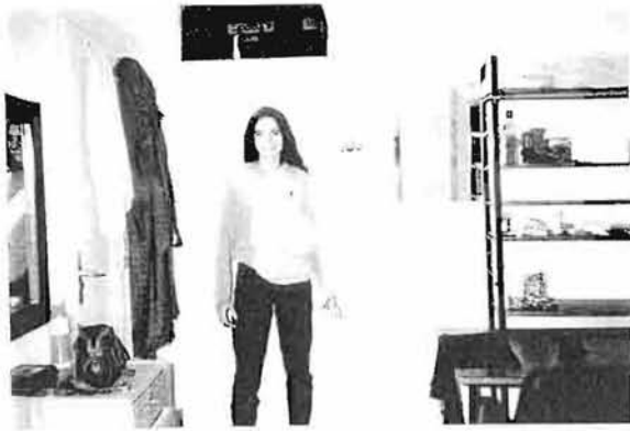
"Miss América" durante Novatadas 3 Octubre 1995. [escrito en español] 20:30 Martes