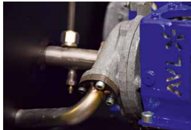
SOFC APU System, Foto: AVL

Das AVL SOFC APU-Gesamtsystem zeichnet sich durch eine kompakte, kleine und leichte Systemintegration aus, es hat ein Volumen von 80 Litern und ein Gewicht von 70 kg. Im Rahmen des Projekts wurden gemeinsam mit Partnern aus der US Nutzfahrzeugindustrie ein Fahrzeugintegrationskonzept erarbeitet und ein Steuergerät für den vollautomatischen Betrieb des Systems entwickelt.