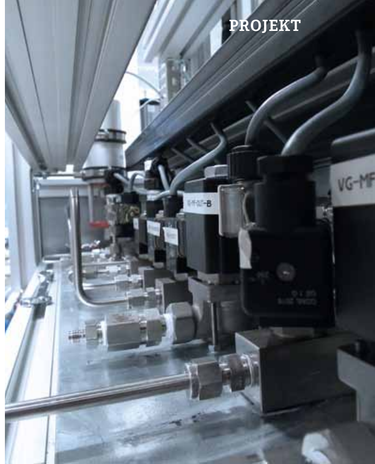
beide Fotos HylyPure-Testanlage TU-Wien