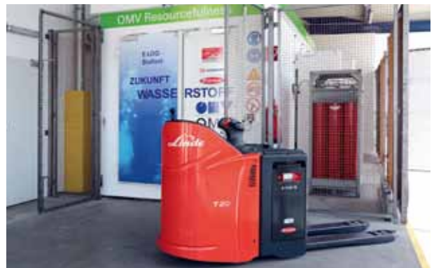
Fahrzeug mit Wasserstoffanlage

Die neuen Fahrzeuge werden seit Juni 2013 im praktischen Industrieumfeld (am Standort DB Schenker in Hörsching) getestet. Im Alltagsbetrieb mit einer anspruchsvollen Logistik-Mehrschichtnutzung konnte die Zuverlässigkeit der Fahrzeugflotte und der Infrastruktur demonstriert werden. Aufgrund der hybriden Betriebsstrategie und Bremsenergieerückgewinnung wird ein hoher Fahrzykluswirkungsgrad (bis zu 53 %) erzielt. Durch die rasche Betankung (< 3 Minuten) sind die Fahrzeuge ständig verfügbar. Das ermöglicht mehr Flexibilität bei gleichbleibender Leistung. Zwei weitere Geräte sind im Rahmen des Projekts H2Intradrive bei BMW in Leipzig im Einsatz. In den nächsten zwei Jahren sollen im weiteren Demonstrationsbetrieb wichtige Erkenntnisse hinsichtlich Lebensdauer, NutzerInnenakzeptanz und -verhalten sowie Wartungs- und Servicebedarf unter realen Bedingungen und fortschreitender Systemalterung generiert werden. Damit will man die Voraussetzungen für einen effizienten und wettbewerbsfähigen Markteintritt schaffen. □