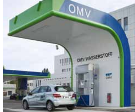
links und Mitte Wind2Hydrogen-Pilotanlage, rechts Wasserstofftankstelle, Fotos: OMV