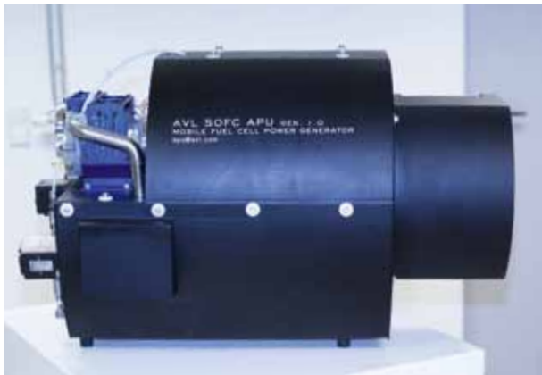
SOFC APU System

Von AVL LIST GMBH wurde in Kooperation mit Forschungspartnern (Institut für Leichtbau und Institut für Wärmetechnik an der Technischen Universität Graz) ein SOFC APU System (Solid Oxide Fuel Cell Auxiliary Power Unit) entwickelt. Das Produkt ist