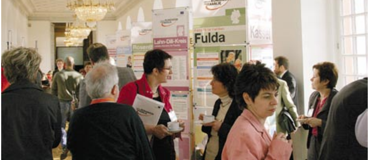
Austausch der Bündnisakteure beim Netzwerktreffen der Lokalen Bündnisse für Familie in Hessen

Angestellten brauchen. Mit der Gründung der Familien-genossenschaft setzt die Metropolregion Rhein-Neckar das Motto ihres Forums Vereinbarkeit Beruf und Familie direkt um: „MehrWert = Beruf + Familie“! Damit wird ein höchst innovativer und gangbarer Weg „raus aus der Demografiefalle“ aufgezeigt. In der Region hat man sich zum Ziel gesetzt bis zum Jahr 2015 zu eine der attraktivsten und wettbewerbsfähigsten Regionen zu werden.