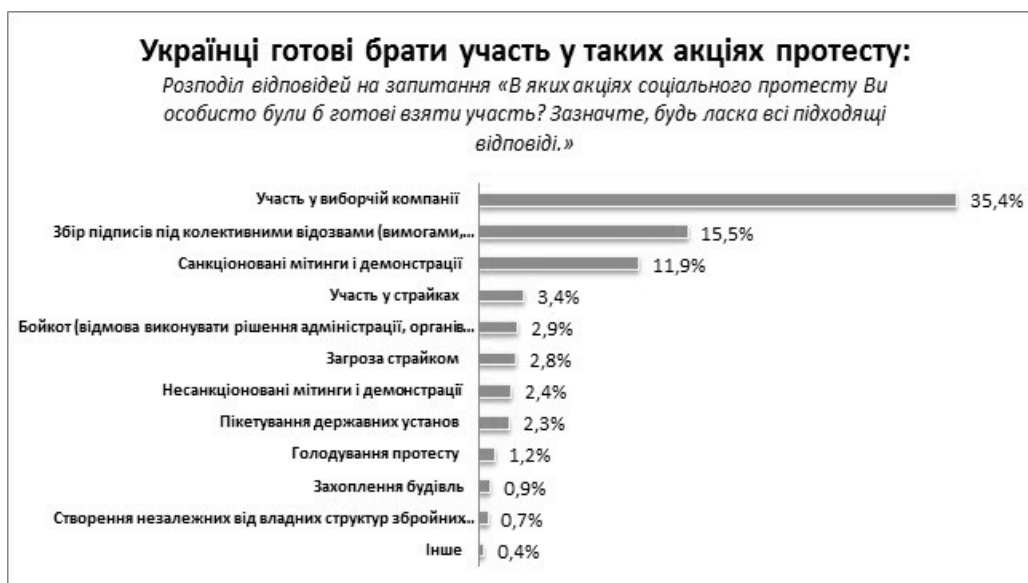
Рис. 1. Відповіді респондентів на запитання за регіоном: «Чи готові Ви брати участь у акціях соціального протесту?»