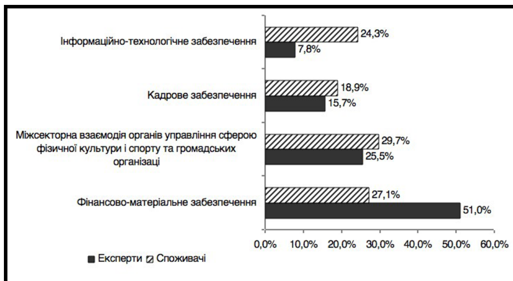
Рис. 2 – Фактори підвищення ефективності управління сферою фізичної культури і спорту (результати контент-аналізу)

Для уточнення факторів підвищення ефективності управління сферою фізичної культури і спорту експертам та споживачам фізкультурно-спортивних послуг було запропоновано відповісти на відкрите питання: «Що, на Ваш погляд, буде сприяти підвищенню ефективності діяльності органів управління сферою фізичної культури і спорту в Запорізькій області?». Було отримано 127 відповідей експертів і 405 відповідей споживачів фізкультурно-спортивних послуг. За допомогою контент-аналізу висловлювань респондентів було отримано 4 фактори-категорії (рис. 2).