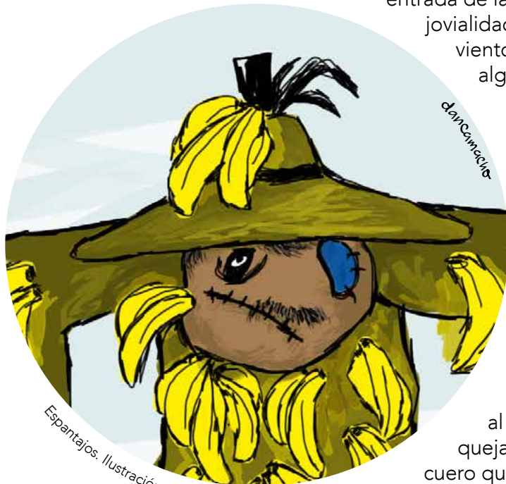
Espantajos. Ilustración de Dannesa Camacho Iglesias.

En mi niñez, mi padre decía que los jinetes no necesitaban silla y, por eso, a todos nos enseñó a montar a pelo. Un impulso me incitaba a auxiliar al caballo del capataz que se quejaba de la incómoda silla de cuero que ahora colgaba de su lomo, un aparato a mi parecer innecesario, pero similar