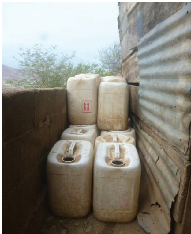
Figura 1. Pimpinas o tanques donde se almacenan 20 litros de agua.

no había dinero, los mismos hombres y mujeres debían transportar los tanques de agua sobre sus hombros, con un peso aproximado de 20 kilogramos (equivalente a 20 litros de agua) hasta sus lugares de habitación en los cerros.