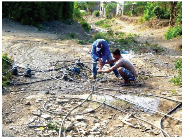
Figura 5. Las personas conectando las motobombas con las mangueras y recolectando el agua