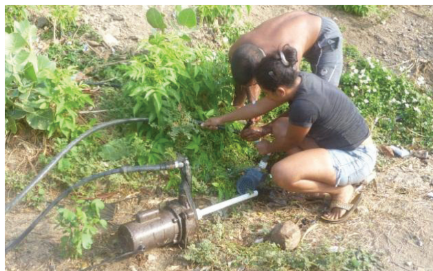
Figura 4. Personas conectando las motobombas a las mangueras con cinta negra.

Generalmente, las motobombas necesitan mantenimiento y estas además se dañan con frecuencia. Cuando alguien de la comunidad tiene dañada la motobomba el domingo –el único día que llega el agua-, uno de los vecinos le facilita la motobomba y la conecta a sus mangueras para recoger el agua o del líquido que éste recolectó le da al otro, procurando así que ninguna persona del vecindario se quede sin este recurso básico (Figura 5).