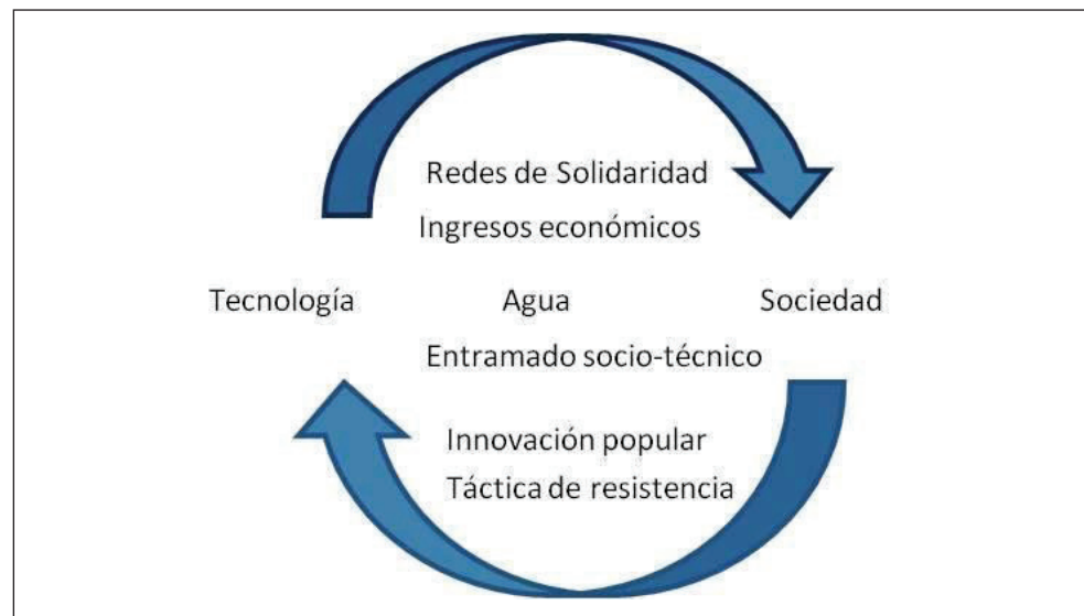
Figura 7. Representación gráfica del entramado sociotécnico y las relaciones que se conformaron a partir del sistema de innovación popular estudiado (Elaboración propia).

Por lo tanto, el sistema de innovación popular para acceder al agua abordado en el presente trabajo, constituye como lo denomina Aibar (2008) un entramado socio-técnico, en el que sociedad y tecnología se coproducen generando una fuerte conexión con el territorio. Así, el uso y recreación de este sistema de innovación ha sido moldeado por las necesidades de la sociedad, pero a su vez, dicho sistema ha permitido afianzar los lazos y redes de solidaridad entre los vecinos y familiares del sector, a tal punto, que si se le daña la motobomba, o por diversas circunstancias alguien del sector no puede recolectar agua, sus vecinos se la recolectan o le dan de la que logró almacenar, pues no conciben que alguien se quede sin agua. Finalmente, el conocimiento y las técnicas empleadas son compartidas y mejoradas permanentemente de manera colectiva haciendo cada vez más eficiente el sistema de innovación. (Figura 7).