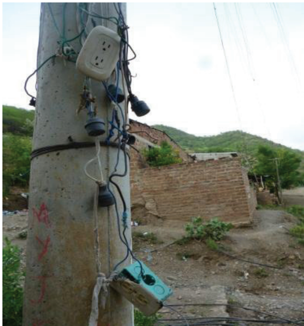
Figura 3. Poste de tendido eléctrico y tomacorrientes de donde se toma la electricidad para las motobombas.