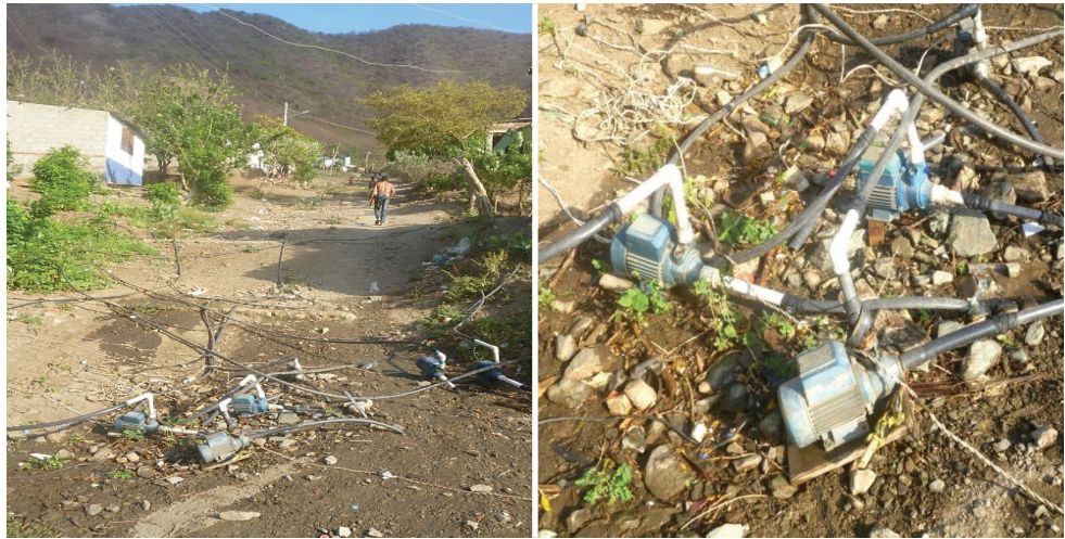
Figura 2. Entrada del sector en el día domingo donde se aprecian las motobombas.

En vista que el sistema funcionaba y les permitía ahorrar el dinero de la compra del agua y evitarse las largas caminatas cargados de pimpinas de agua, poco a poco, los vecinos del sector comenzaron a emplear este sistema (Figura 2).