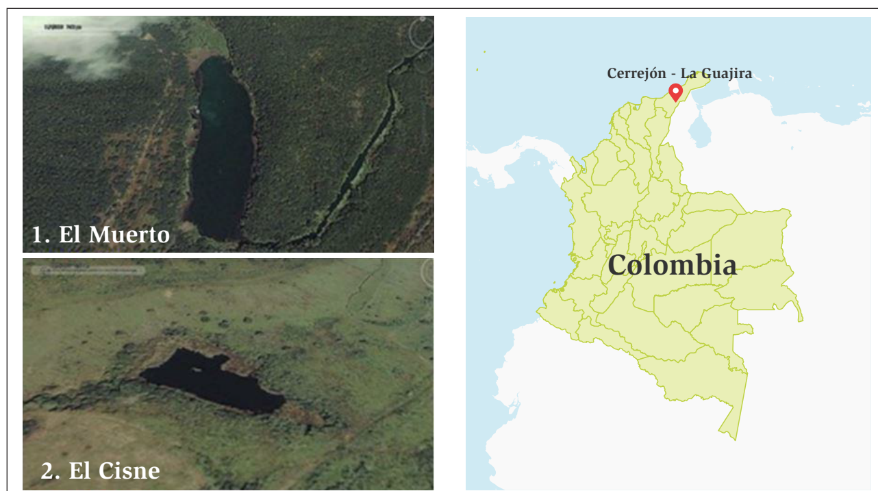
Figura 1. Localización de las lagunas El Cisne y El Muerto. En la parte superior se observa la laguna El Muerto, mientras que en la parte inferior la laguna El Cisne. Tomado y modificado de Google Earth.

se utilizó una atarraya con ojo de malla de 0,5 cm y se fijaron en formol al 10 %. Los avistamientos de aves y otros vertebrados se desarrollaron con el método de muestreo relevamiento por encuentros visuales (Gallina y López-González, 2011). Para el avistamiento de aves se utilizaron binoculares marca Bushnell 17-5010. La identificación de las aves se realizó con ayuda de la guía de Steven (2001) y la de los reptiles con Angarita-Sierra et al. (2013).