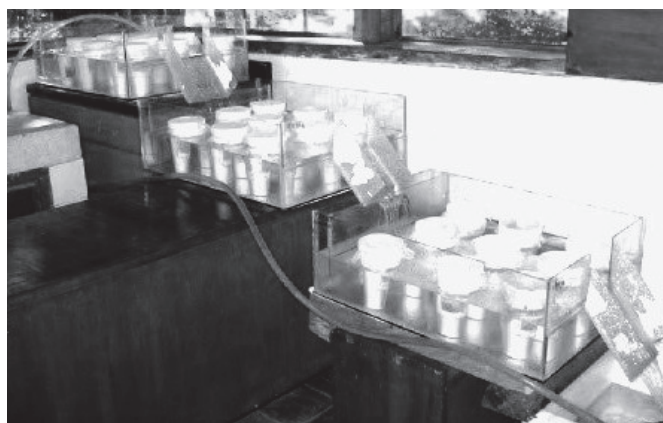
Figura 2. Sistema de cría adaptado: cámaras de crianza en acuarios.