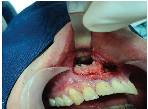
Figura 3. Imagen intraoperatoria que muestra corona de órganos dental supernumerario mesiodens en relación con el piso de la fosa nasal.

nasal, posteriormente al liberar la membrana del piso de la fosa nasal, se observó la corona del mesiodens incluido, se realizó osteotomía alrededor de la corona y odontosección, seguidamente con elevador recto apical se efectuó la extracción, primero de la corona dental y después la porción radicular. (Figura 3 y 4). Finalmente se realiza hemostasia e irrigación del área quirúrgica con suero fisiológico, se confrontan los bordes incididos con puntos simples utilizando Vicryl 3-0, se establece terapia antibiótica, con Amoxicilina cápsula de 500mg, una cada 8 horas por 7 días y analgésica antiinflamatoria con Nimesulide tabletas de 100mg una cada 12 horas por 4 días, además terapia con corticoides, Dexametasona ampolla de 8 mg única dosis. En el control postquirúrgico realizado a los 8 días, se observó buen proceso de cicatrización 18,19 .