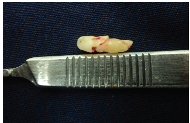
Figura 4. Imagen macroscópica del órgano dental extraído.

Se realizó junta quirúrgica en la cual se decidió realizar un nuevo procedimiento, previo a la firma de un consentimiento informado donde se le explicó al paciente las posibles complicaciones y riesgos, se aplicó técnica anestésica infraorbitaria e infiltración de piso de fosas nasales extra oralmente del lado derecho y a nivel de espina nasal logrando un bloqueo de la zona; se realizó incisión lineal en fondo de surco y se levanta colgajo mucoperiostico, exponiendo el piso de la fosa