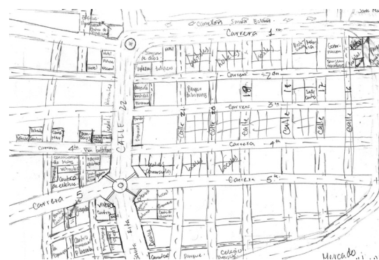
Figura No. 2 Mapa Mental tipo Secuencial

Los elementos funcionales de la representación del Centro Histórico de Santa Marta muestran importancia de la práctica del espacio en la construcción de los mapas mentales (Figuras 1 y 2), aunque no definen la ciudad en sí misma, por eso, no se tomaron las sendas y barrios -propuestos por Lynch- por ser "no lugares" las partes que los definen (vías rápidas, Centros Comerciales, etc.), pues de lo contrario se extraerían de ellos elementos que disocian del contexto cultural en el cual se inscriben.