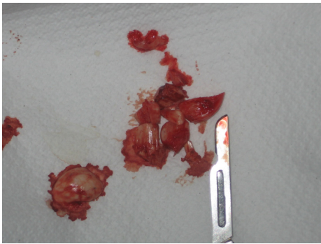
Figura 2. Se observan fragmentos de hueso luego de la ostectomía.

La cirugía se realizó bajo anestesia local con lidocaína 2% y adrenalina 1:100.000 aplicando la técnica mandibular bilateral. Con un bisturí bard-parker número 3 y hoja No. 15. Se realizó una incisión horizontal hasta el hueso con la elevación de un colgajo en sobre, sin el uso de incisiones relajantes, de espesor total para exponer la cortical lingual, luego se realizó osteotomía y ostectomía, utilizando fresa zécra para dividir en varios fragmentos, seguido a esto se utilizó cincel y martillo para realizar ostectomía total de los torus mandibulares (Figura 2).