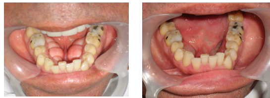
Figuras 6 y 7. Se observa el preoperatorio y postoperatorio.