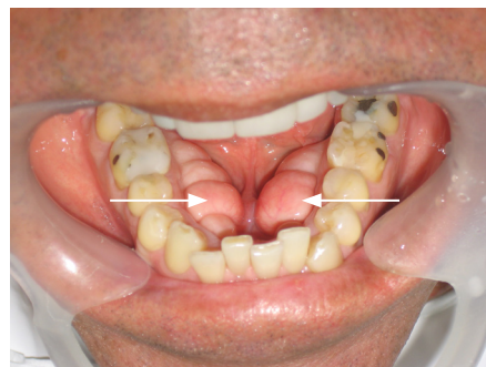
Figura 1. Se observan torus multilobulados en región de premolares a molares mandibulares bilaterales.

Paciente de sexo masculino de 47 años que presenta lesión tumoral a nivel de tabla interna de la mandíbula, bilateral, de consistencia pétreo, multilobulado, base sésil, con poca irrigación, de larga data de aparición, de crecimiento lento, asintomático, cubierto por una mucosa de apariencia normal (Figura 1).