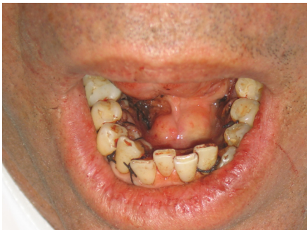
Figura 3. Se observa la sutura en puntos simples con seda negra 4.0.

Finalmente se realizó, hemostasia local, limpieza del área, irrigación con solución salina, reposición del colgajo, sutura con seda negra 4.0 (Figura 3).